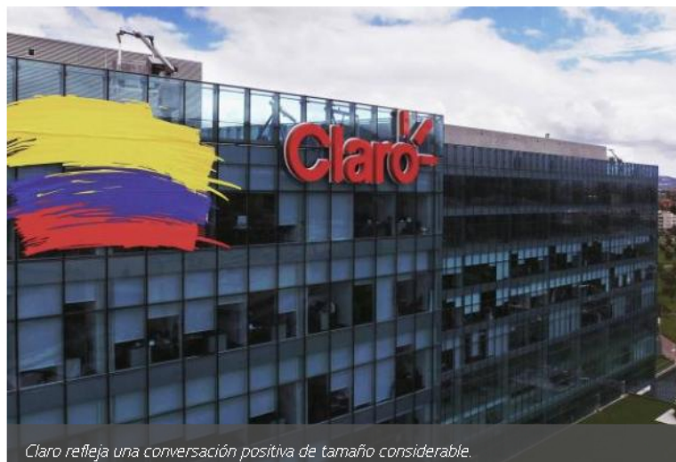
Claro refleja una conversación positiva de tamaño considerable.

También menciona que Claro refleja una conversación positiva de tamaño considerable, derivada de una activación en la que vinculó a un artista, pero estas interacciones contrastan con el volumen de conversaciones alusivas a inconformidades por los servicios.