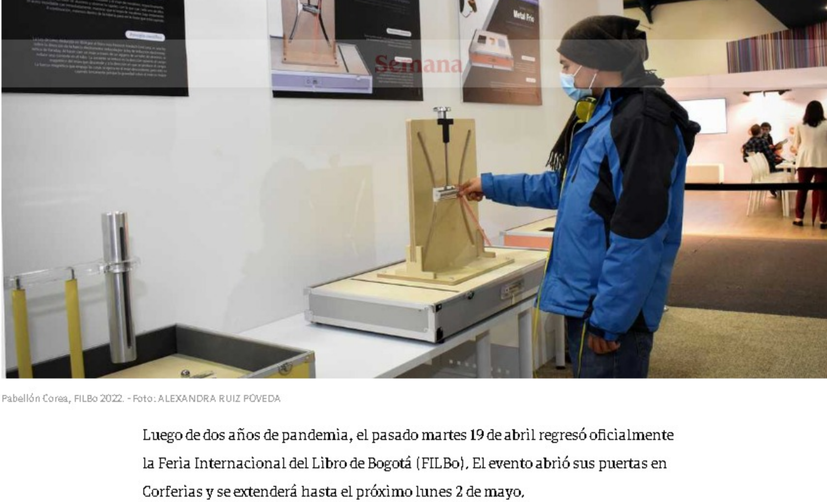
Pabellón Corea, FILBo 2022

Luego de dos años de pandemia, el pasado martes 19 de abril regresó oficialmente la Feria Internacional del Libro de Bogotá (FILBo). El evento abrió sus puertas en Corferías y se extenderá hasta el próximo lunes 2 de mayo.