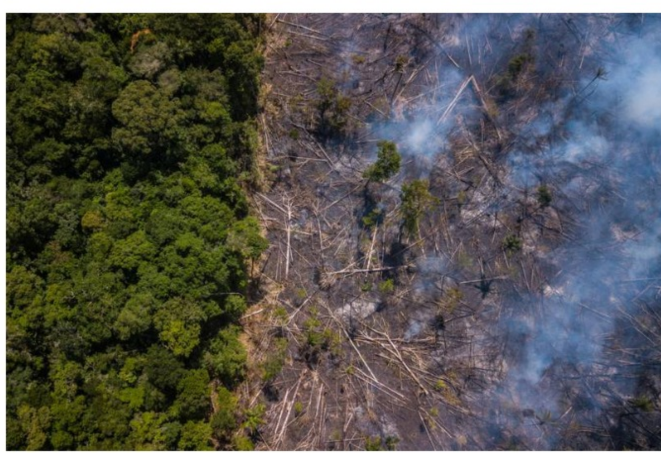
La Taxonomía Verde en Colombia permitirá definir qué proyectos cumplen los requisitos para ser considerados verdes

Colombia presentó su Taxonomía Verde, pero en la bolsa local hay varias empresas que ya traen un camino recorrido. Así está el panorama en el mercado local