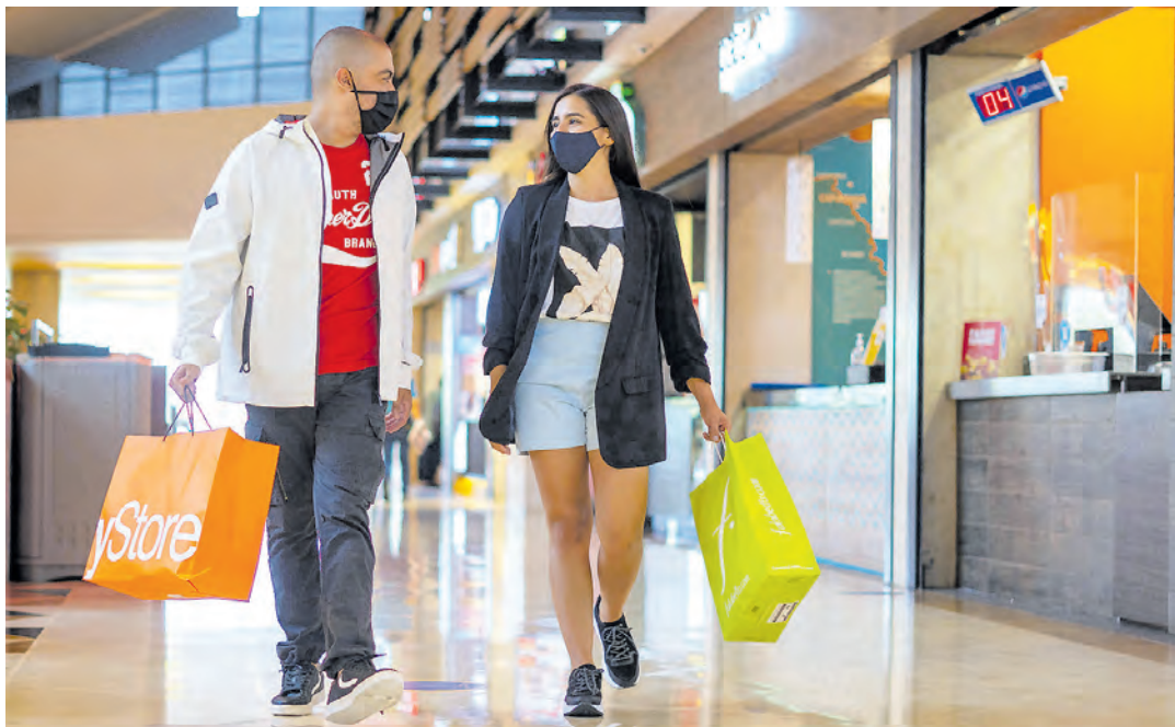
Comercios se preparan para las fechas especiales que tendrán lugar antes de acabar el año.

Con 3 días sin IVA, Halloween, Black Friday, Cyberlunes y Navidad se espera que motiven las compras. Pág. 3