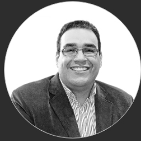
ANALISTAS | 28/09/2021