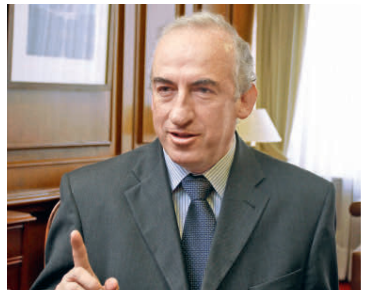
Leonardo Villar, gerente del Banco de la República, daría a conocer decisión sobre las tasas el 30 de septiembre.

Esto cobra relevancia teniendo en cuenta que la eventual salida de esos recursos, podría encarecer el dólar en Colombia, puesto que su precio depende de la oferta y la demanda. En consecuencia, si circulan menos divisas en la economía, puede subir la tasa de cambio, que actualmente se mueve en $3.800, pero en agosto alcanzó los $4.000 ■