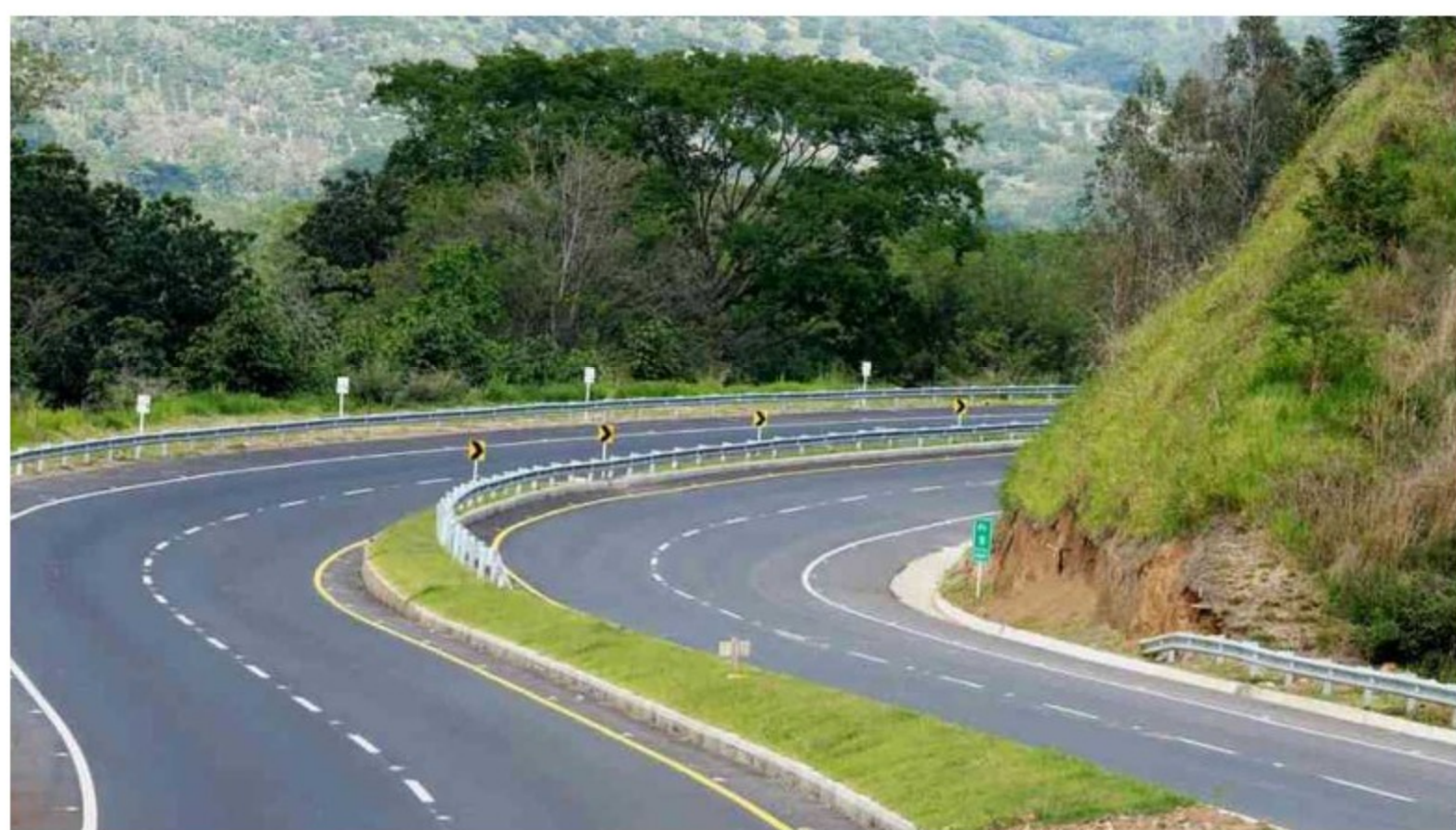
Argos creó Odinsa Vías para operar las concesiones Autopistas del Café, Pacífico 2, Túnel de Oriente y Malla Vial del Meta

“Respetamos la decisión que Ecopetrol pueda tomar frente a las concesiones que tiene ISA. Si ellos toman la decisión de desinversión, estaremos muy interesados en participar y comprar esos negocios”, dijo Velásquez.