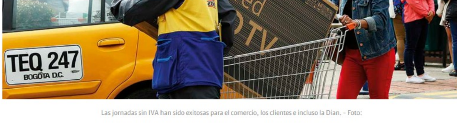
Las jornadas sin IVA han sido exitosas para el comercio, los clientes e incluso la Dian.

SEMANA: Para sectores afectados como el comercio, el turismo o los restaurantes, ¿qué medidas hay?