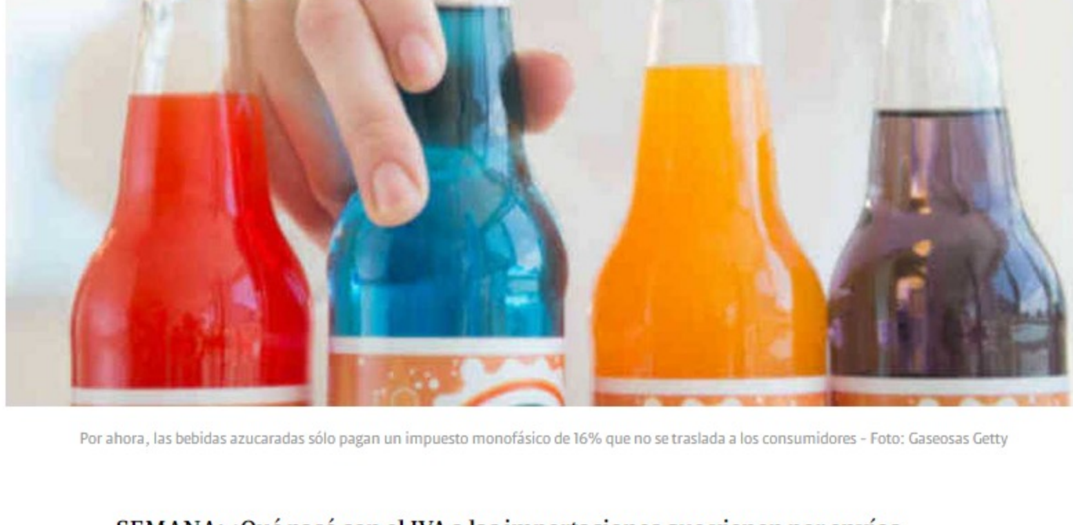
Por ahora, las bebidas azucaradas sólo pagan un impuesto monofásico de 16% que no se traslada a los consumidores

J.R.: Soy muy franco en mi planteamiento, desde el primer momento señalé que teníamos que hacer una propuesta simple, sencilla, 35 artículos. Eso significó que muchas de las iniciativas que había tenido el anterior ministro, Alberto Carrasquilla, de impuestos verdes, de impuestos saludables, esto que se denomina en economía impuestos pigouvianos, pues no se incluyeron. Me comprometí también a garantizar unos consensos con distintos sectores de la economía que iban a poner recursos para esta propuesta y a no afectar los consumidores, en la que hicimos. Y, además, me comprometí a no esotar el bolsillo de los consumidores, a no afectar con temas del IVA, o de impuestos parecidos que gravan el bolsillo de las clases medias, de las menos favorecidas y más vulnerables. Muchos de los impuestos que pueden tener bondades o virtudes, y no entrar en esa discusión, se incluyeron y otros no, justamente para garantizar la simplicidad; esa construcción de consensos y no afectar el bolsillo de los consumidores. Se pusieron de presente nuevos impuestos y el Congreso dio el debate. El Congreso estudió estos temas y adoptó una decisión. Yo soy respetuoso de esa decisión democrática.