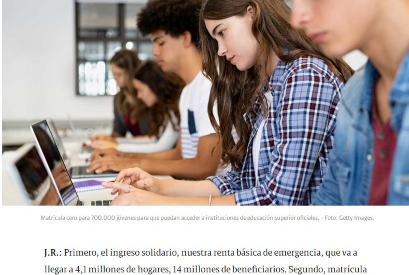
Matrícula cero para 700.000 jóvenes para que puedan acceder a instituciones de educación superior oficiales.

SEMANA: ¿Para cuáles programas sociales se garantizan los recursos?