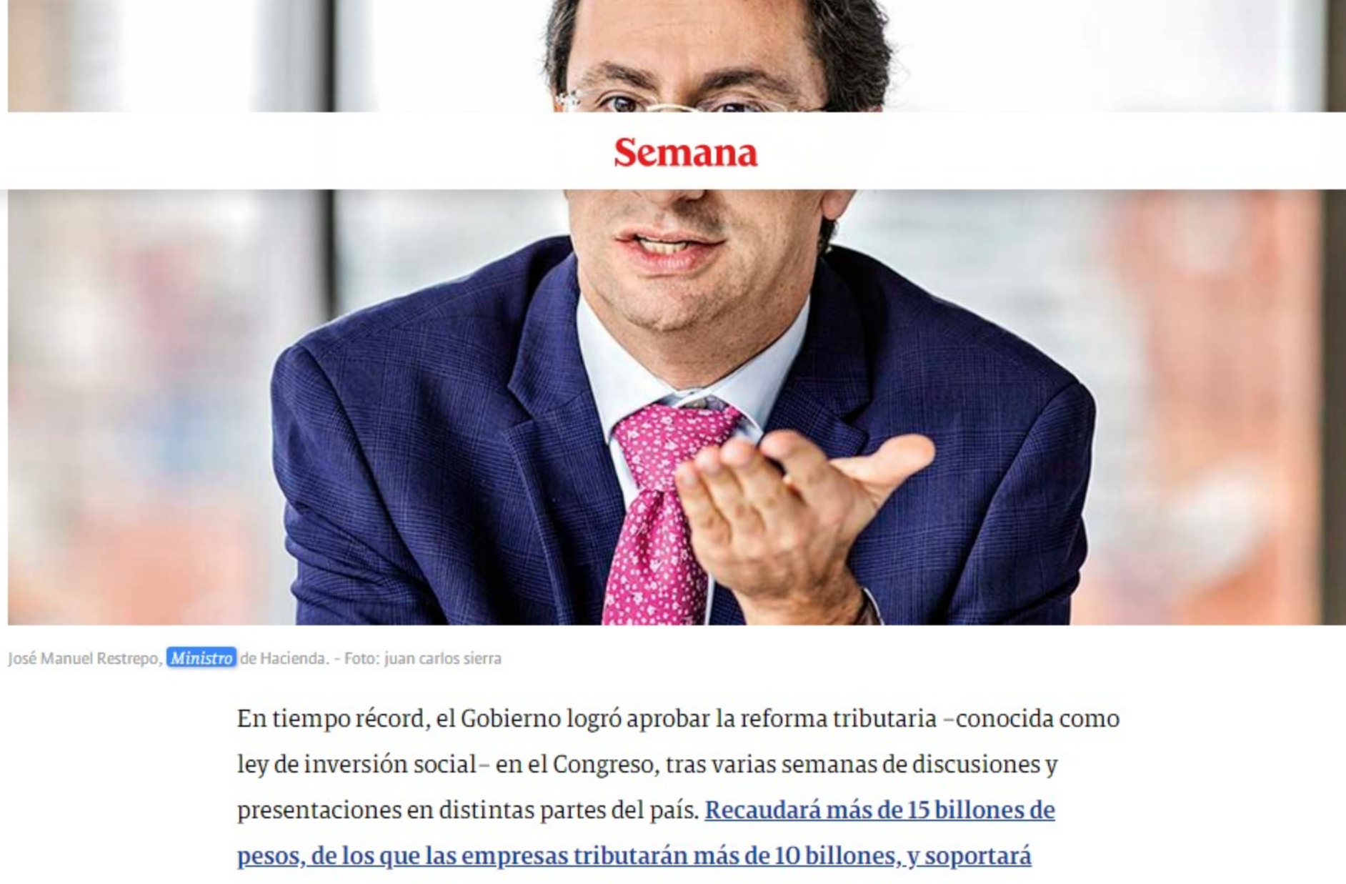
José Manuel Restrepo, Ministro de Hacienda.

En tiempo récord, el Gobierno logró aprobar la reforma tributaria –conocida como ley de inversión social– en el Congreso, tras varias semanas de discusiones y presentaciones en distintas partes del país. Recaudará más de 15 billones de pesos, de los que las empresas tributarán más de 10 billones, y soportará programas sociales que quedaron tras la pandemia. La ley, que está para sanción presidencial, tuvo su aprobación días después de que el Gobierno concretara dos importantes movidas en su financiación: una, la venta del 51,4 por ciento de las acciones de ISA a Ecopetrol por 14,2 billones de pesos, y la compleja operación de derechos de giro, con los que el país accede a cerca de 2.800 millones de dólares que le entrega el FMI al Banco de la República para darle liquidez a la economía.