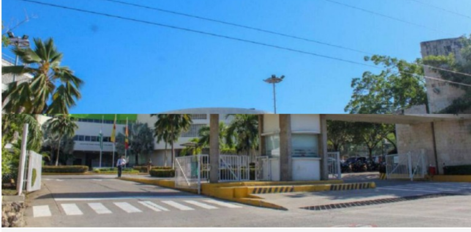
El foro se realizará de manera virtual este jueves 16 de septiembre de 10:00 de la mañana a 12:30 del mediodía

El foro se realizará de manera virtual este jueves 16 de septiembre de 10:00 de la mañana a 12:30 del mediodía