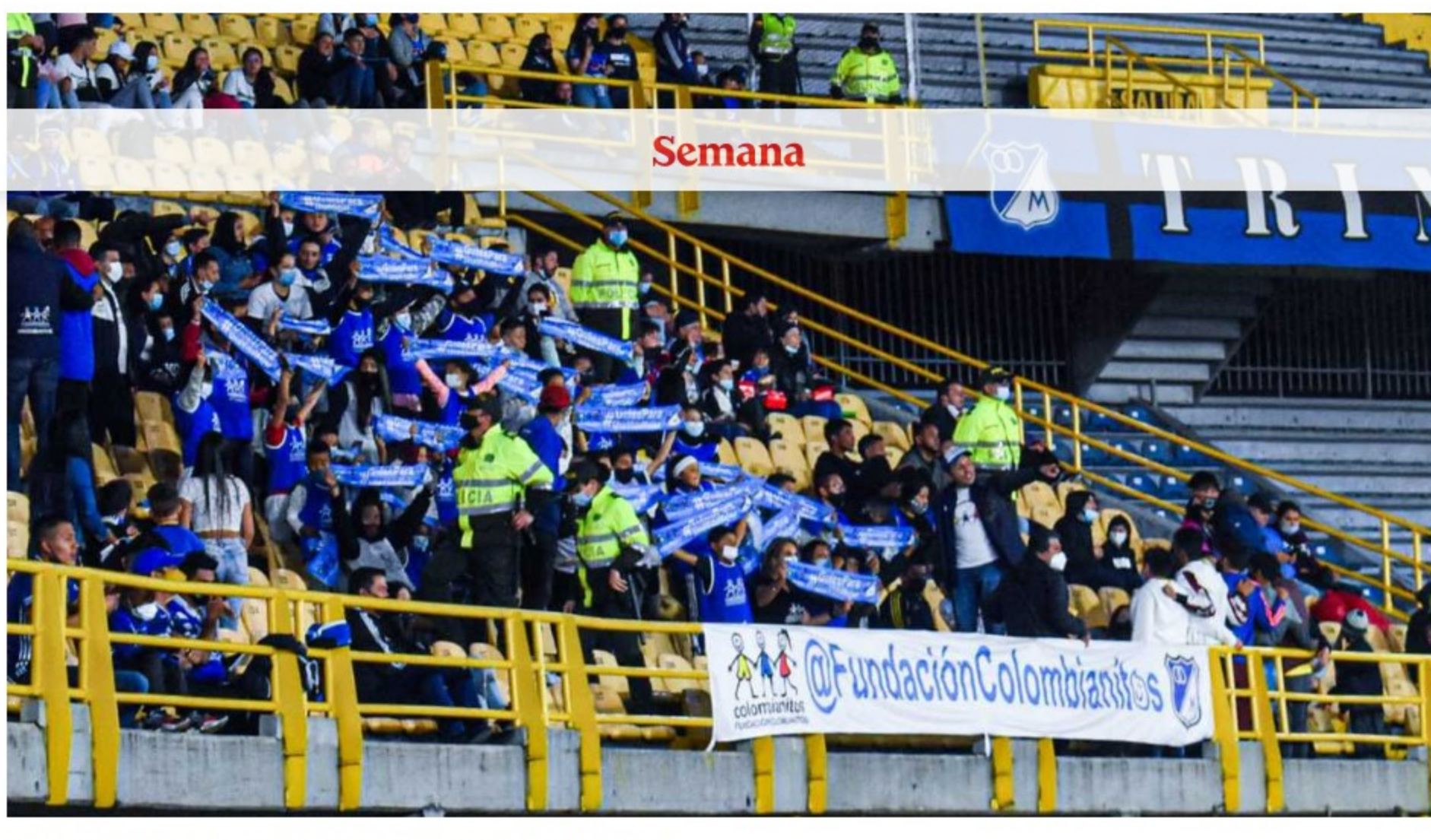
Niñas y niños de la Fundación Colombianitos en El Campín.

El pasado lunes se vivió una noche especial para los hinchas de Millonarios porque por fin pudieron volver a ver a su equipo en El Campín. Sin duda alguna fue una buena noche para quienes regresaron al estadio, pero para otros fue una experiencia inolvidable al ingresar por primera vez al recinto deportivo para ver a la escuadra que los hace vibrar.