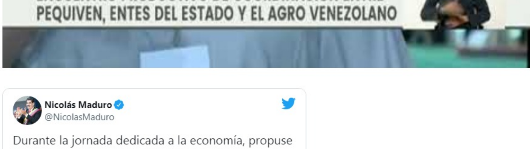
ENCUENTRO PRODUCTIVO DE COORDINACIÓN ENTRE PEQUIVEN, ENTES DEL ESTADO Y EL AGRO VENEZOLANO

Dos días después, la Superintendencia de Sociedades sometió a control a la empresa Monómeros Colombo-Venezolano. La determinación fue tomada mediante la Resolución número 301-004466, del 20 de agosto de 2021, y la medida se constituye como el máximo grado de supervisión que puede ejercer la Superintendencia sobre una compañía vigilada. Esto significa que la empresa estará bajo "el máximo grado de supervisión" con el fin de "ordenar los correctivos necesarios para subsanar una situación crítica de orden jurídico, contable, económico o administrativo", explicó la Superintendencia. Esta decisión, sin embargo, solo se conoció hasta este martes 7 de septiembre, día en que representantes de Maduro y de la oposición adelantaban otra jornada de diálogos en México.