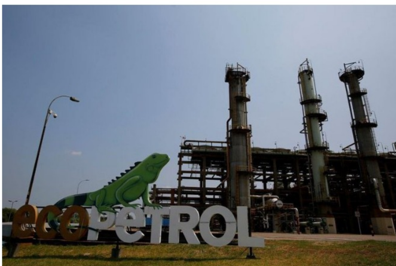
Foto der archivo. Vista de la refinería de petróleo Ecopetrol en Barrancabermeja, Colombia, 1 de marzo, 2017. REUTERS/Jaime Saldarriaga

Para expresar su inconformidad, se levantaron en protestas para evitar que funcionarios de Ecopetrol, empresa de la que es filial Hocol, entraran a los campos petroleros Toy, Santa Rita y Toldado. Con estos actos, pretendieron hablar directamente con representantes de la petrolera para conocer las nuevas condiciones. La organización, por esos días, aclaró que sostendría los compromisos que se tenían con la comunidad respecto a empleabilidad y demás condiciones.