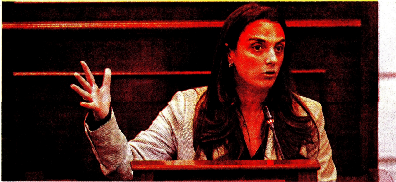
Hace una semana la ministra Abudinen tuvo que enfrentarse a una moción de censura que sigue en firme en el Congreso. CEET

Tras la adjudicación de ese proyecto de $1 billón a la Unión Temporal Centros Poblados, se entregó un anticipo de $70.000 millones con este fin, y luego se em-