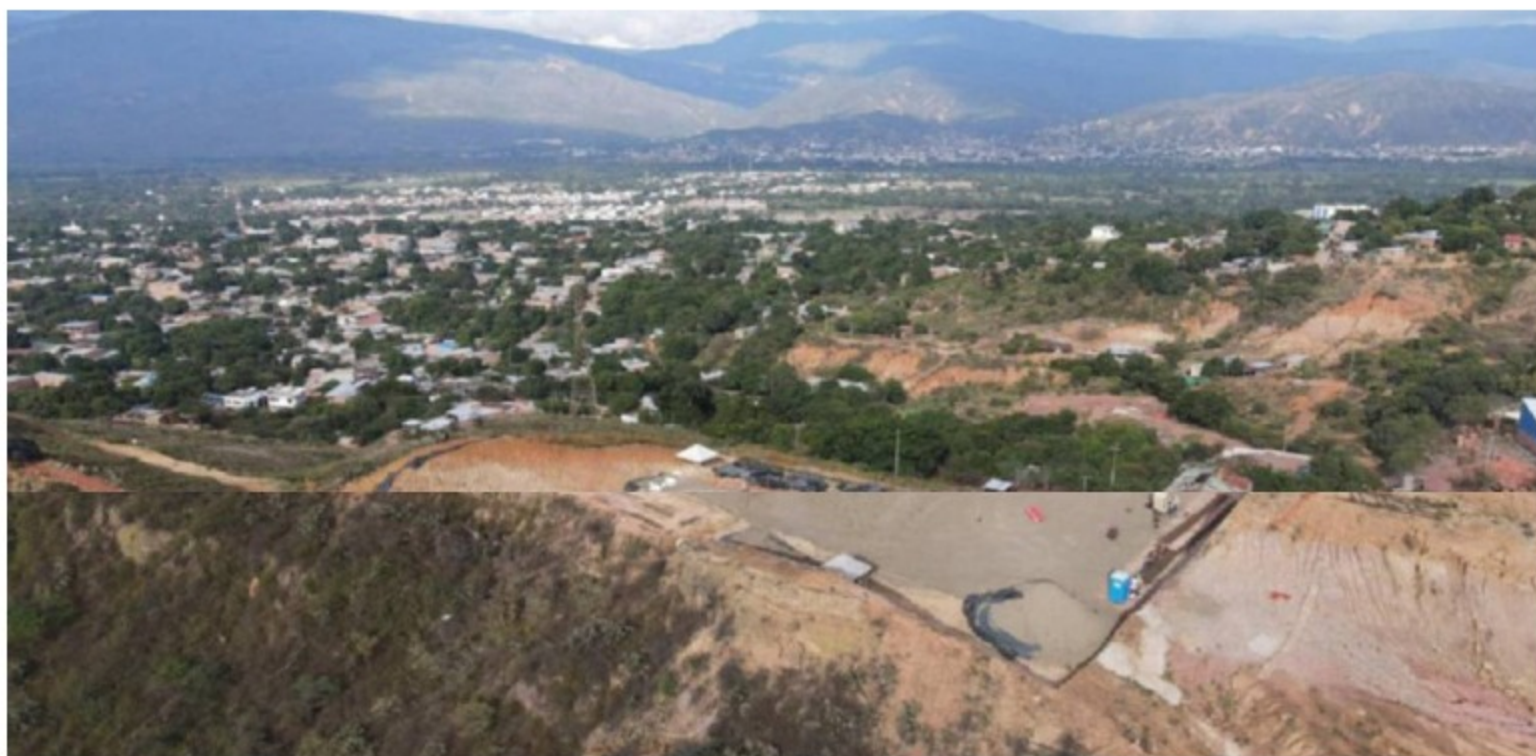
Acueducto metropolitano

En la próxima junta directiva se revisará el papel de la firma contratista