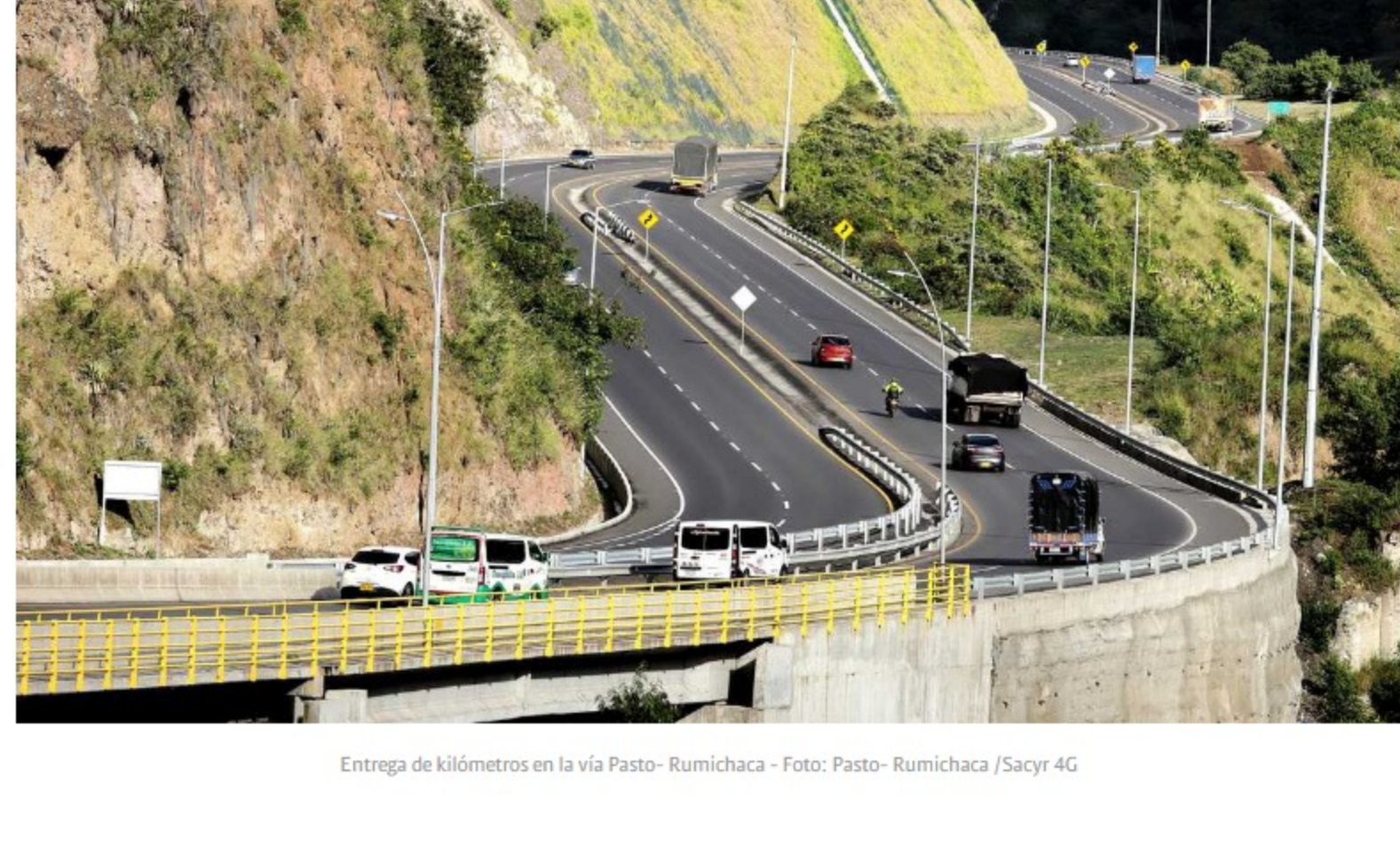
Entrega de kilómetros en la vía Pasto- Rumichaca

"En caso de darse un incremento adicional del 25% al asfalto como insumo fundamental en el mantenimiento, rehabilitación, mejoramiento y construcción de carreteras, casi que de manera directa, se disminuyen los alcances en todos los contratos en ejecución, de manera proporcional a ese incremento en los contratos de mantenimiento y rehabilitación", explicó la CCI.