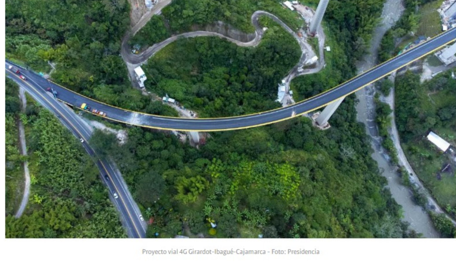
Proyecto vial 4G Girardot-Ibagué-Cajamarca

Los constructores agremiados en la Cámara Colombiana de la Infraestructura (CCI) explican que el acero ha tenido un "crecimiento insostenible" y ha generado además de la disminución de metas físicas en todos los contratos de obra pública en ejecución, dos problemas adicionales: