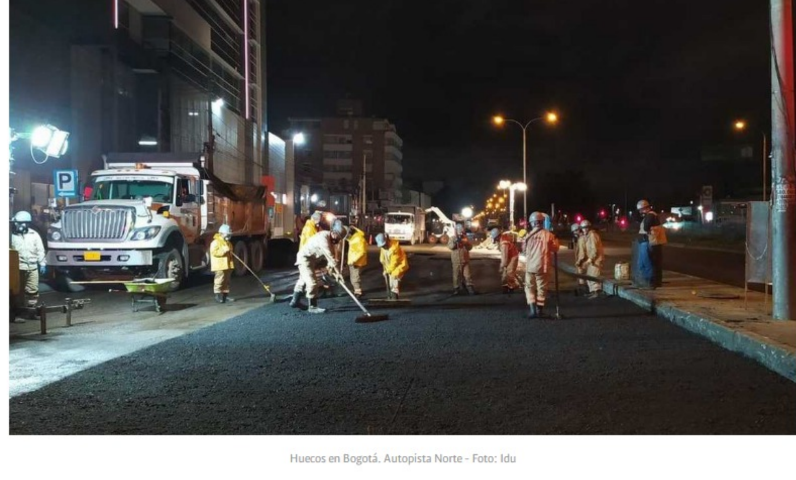
Huecos en Bogotá. Autopista Norte

Por ejemplo, se tienen contratados casi 12 billones de pesos para la pavimentación de más de 2.500 km de vías nacionales primarias, las cuales se reducirían las metas físicas de intervención en casi un 5% de la longitud a intervenir (ya que es el peso promedio del asfalto dentro de la mezcla asfáltica y ponderándolo con todos las actividades en este tipo de contratos). Lo anterior implica que se dejarían de ejecutar más de 100km de estas carreteras.