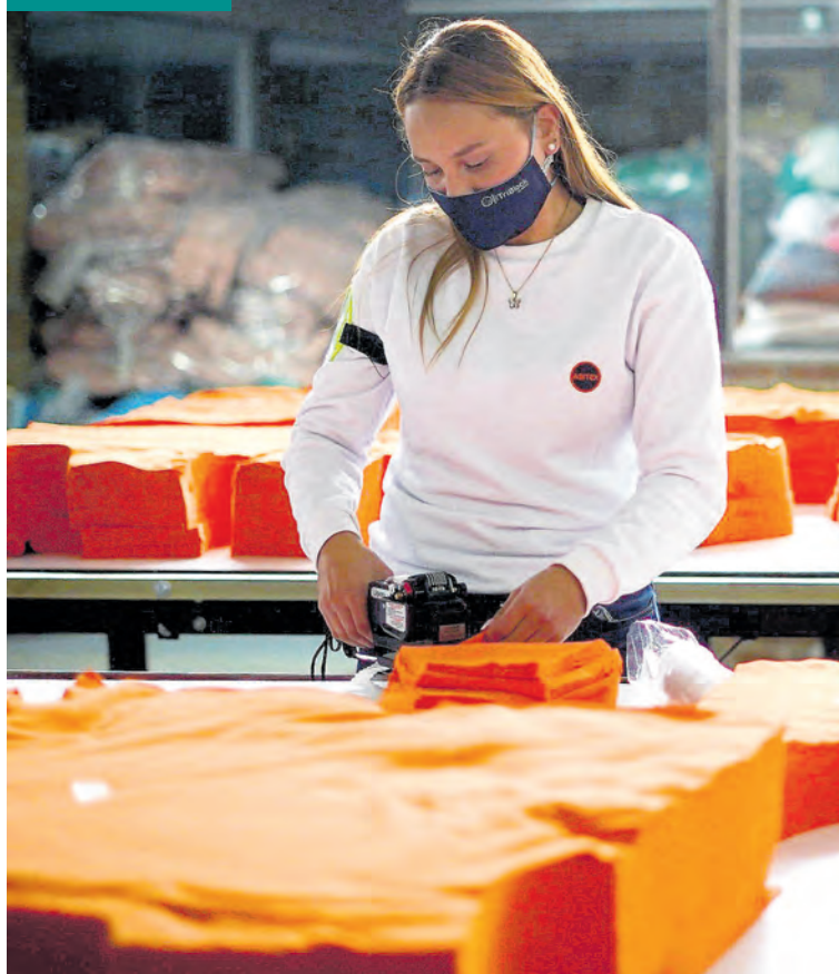
La ayuda del Estado cubre el 25% de un salario mínimo a empresas. CEET