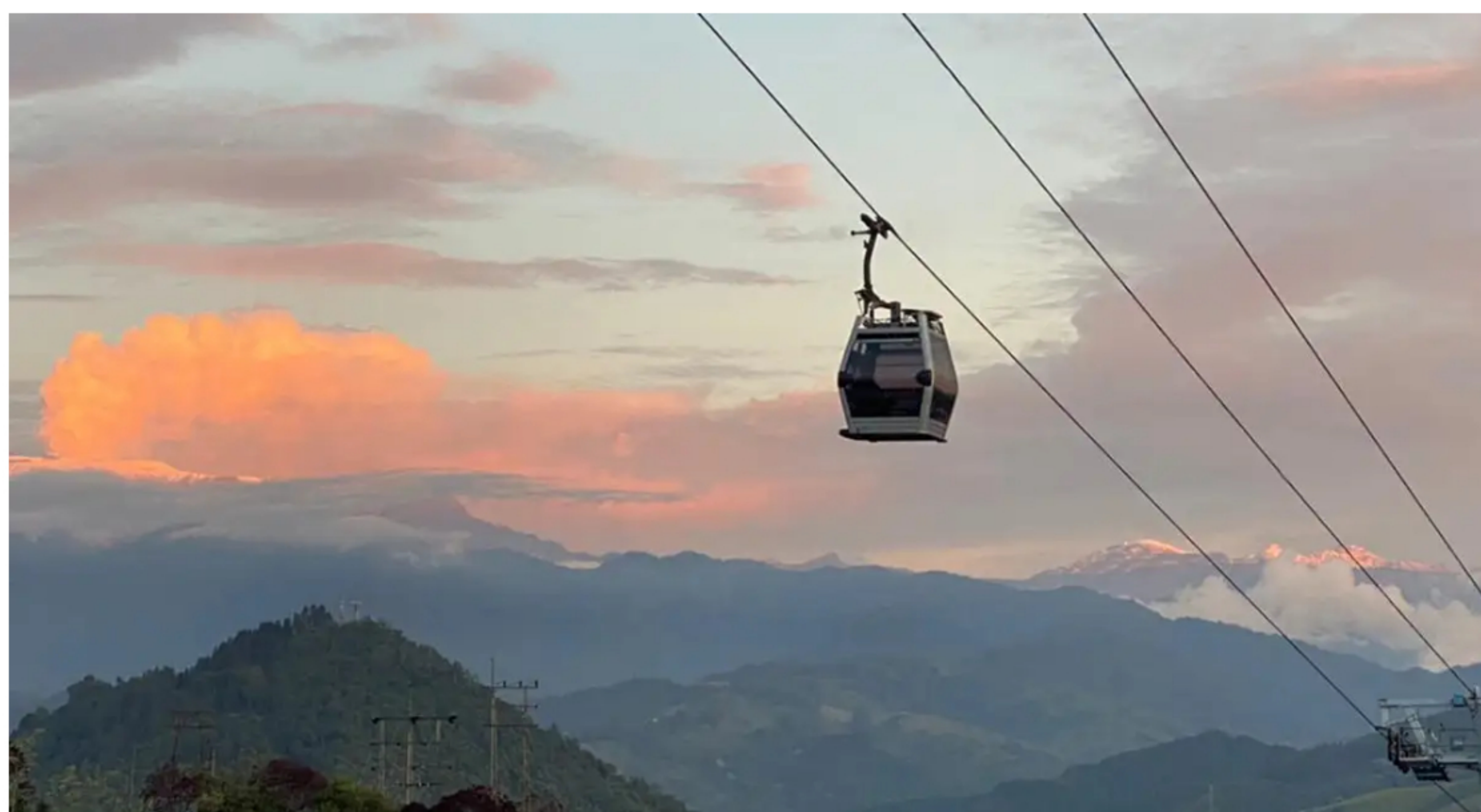
Viajar entre el Tolima y Caldas, y viceversa, en Cable Aéreo era un gran atractivo en los años 30's. Foto: Twitter @CableManizales

Atravesar Manizales en Cable Aéreo y llegar hasta Mariquita, era posible hace 100 años atrás pero ahora resalta una iniciativa "turística" que propone 'reactivar' el tramo en Cable Aéreo, Manizales-Mariquita y esto es lo que se sabe de la iniciativa .