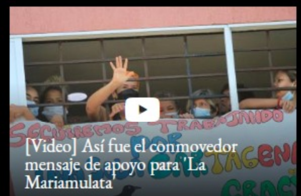
[Video] Así fue el conmovedor mensaje de apoyo para 'La Mariamulata'