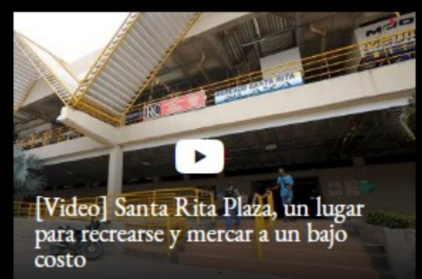
[Video] Santa Rita Plaza, un lugar para recrearse y mercar a un bajo costo