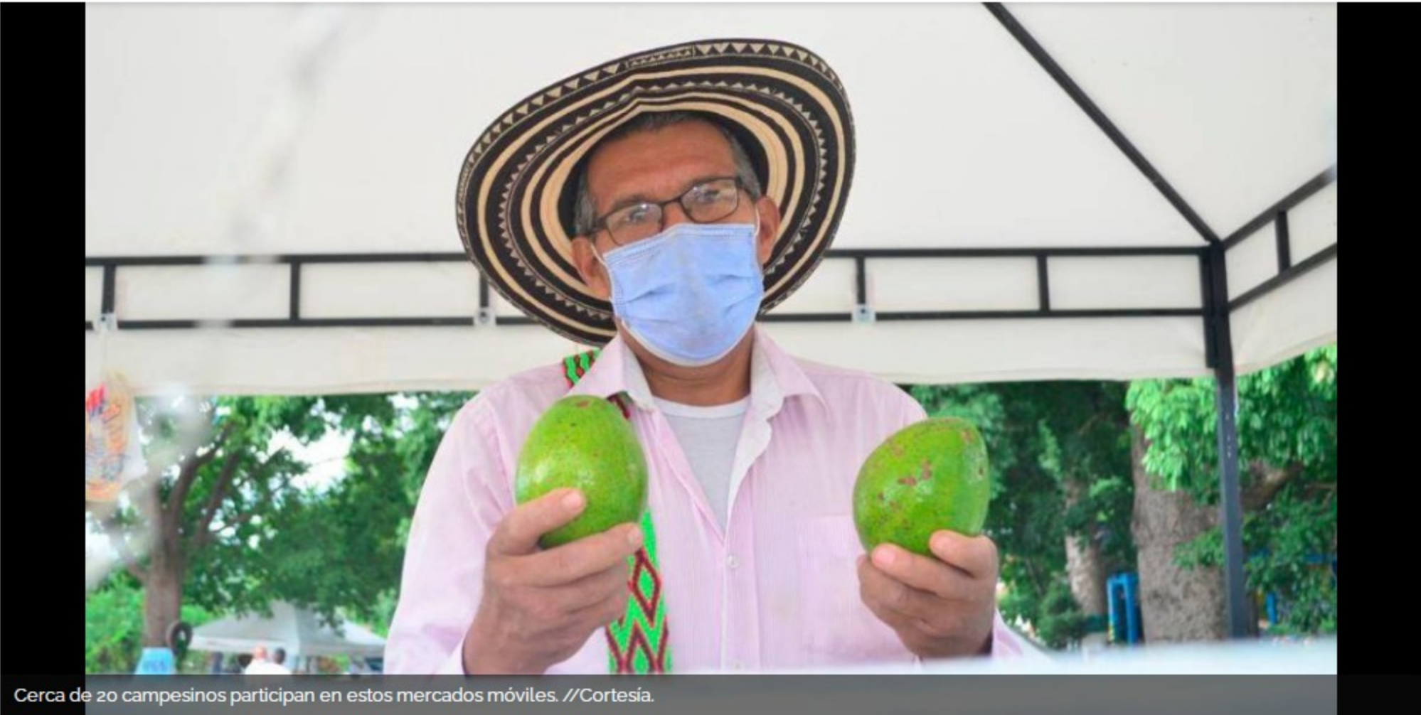
Cerca de 20 campesinos participan en estos mercados móviles.

Los productos más frescos del campo estarán disponibles en el parqueadero de la Fundación Santo Domingo.