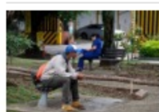
Bucaramanga se mantiene como la tercera con menor desempleo

El EIA establece el Plan de Contingencia que identifica los riesgos potenciales derivados de la ejecución de las actividades, las medidas de reducción y las acciones contempladas para el manejo de las eventuales contingencias.