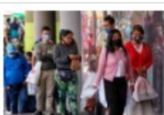
Tiendas físicas jalaron las ventas en el Día sin IVA

Se incorporan al EIA al menos 16 Tecnologías de Mínimo Impacto (TMI), orientadas a la minimización de impactos ambientales y a la reducción de riesgos.