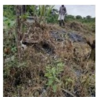
En fuentes hídricas y en otras zonas quedó el crudo regado.

No es la primera vez, entre atentados y el hurto de crudo, han ocurrido varios episodios de contaminación en fuentes hídricas de la costa pacífica nariñense. En 2019 hubo más de cinco atentados, en 2020 también y el presente año, han ocurrido otros hechos.