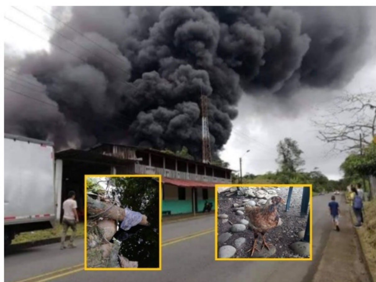
No es la primera vez, entre atentados y el hurto de crudo, han ocurrido varios episodios de contaminación en fuentes hídricas de la costa pacífica nariñense.

Por hurtar el crudo, habrían desencadenado el incendio de gran magnitud en el Oleoducto Trasandino.