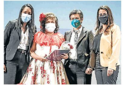
Alcaldía de Bogotá

Más de $28.000 millones para cultura en Bogotá