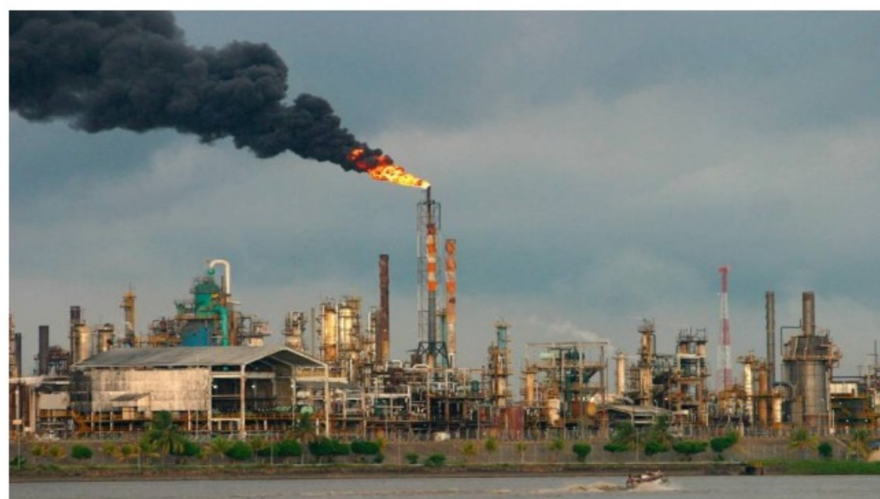
Refinería de Barrancabermeja

No es nueva la controversia acerca de si es correcto el pago de impuestos locales por parte de Ecopetrol , en el pasado ya se han planteado dudas, presentado reclamaciones y hasta iniciados procesos judiciales.