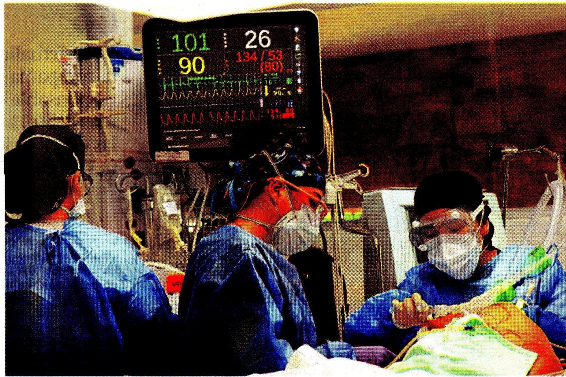
Ecopetrol donó 10.000 pruebas covid en Barrancabermeja para facilitar la identificación de personas infectadas.

Así mismo, donó 10.000 pruebas covid en la cabecera de Barrancabermeja para facilitar la identificación de personas infectadas e iniciar los protocolos de aislamiento. También, se diseñaron y entregaron caretas full fase para la protección del personal