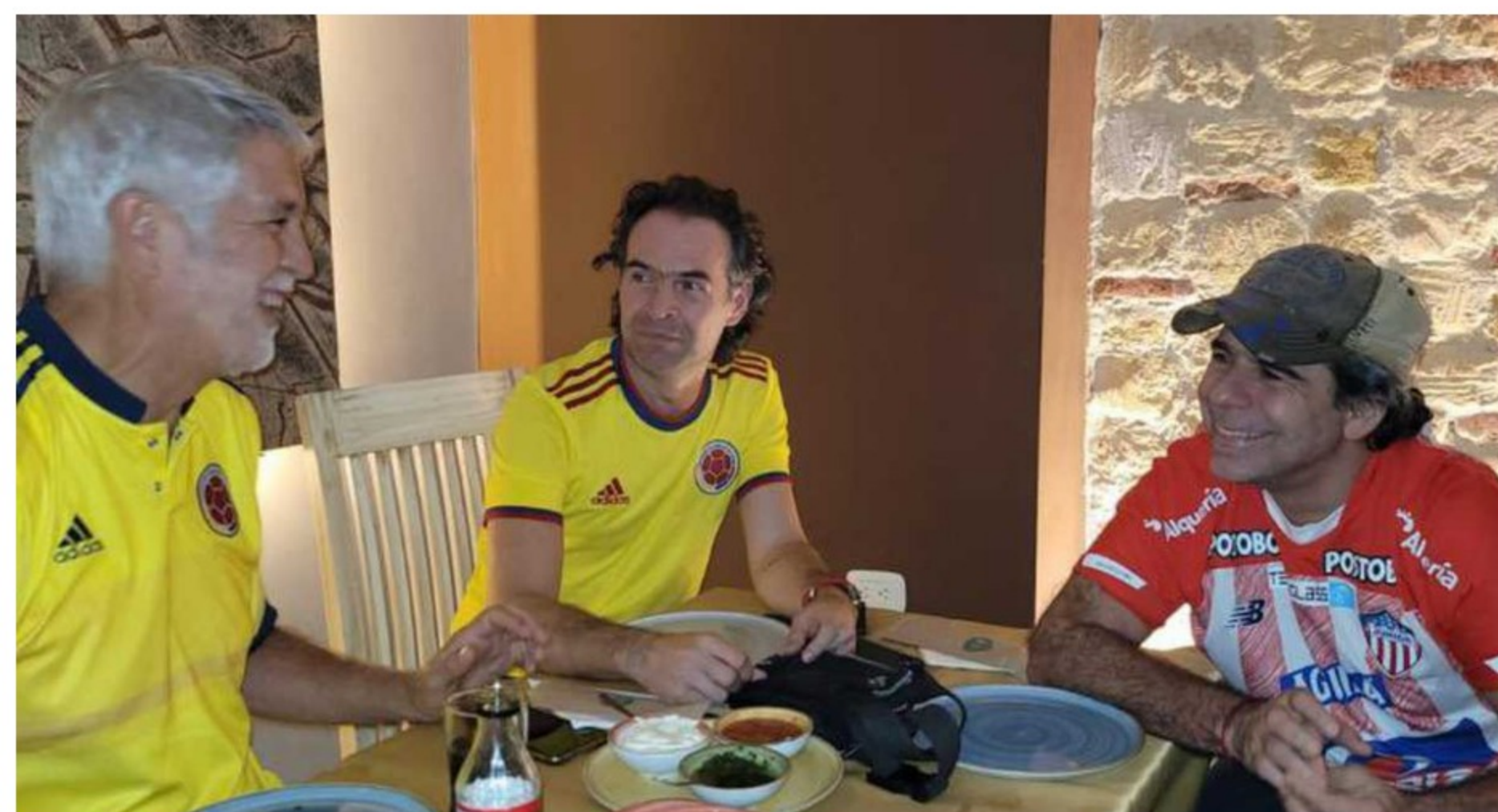
Además del encuentro del lunes festivo, Alex Char, Federico Gutiérrez y Enrique Peñalosa se encontraron nuevamente este martes.

Federico Gutiérrez no dejó pasar el comentario y se fue lanza en ristre contra el líder de la Colombia Humana: “Curioso. Yo veo cuatro colombianos que queremos a nuestro país vs un ‘exguerrillero’ preocupado por convertir a Colombia en algo miserable” .