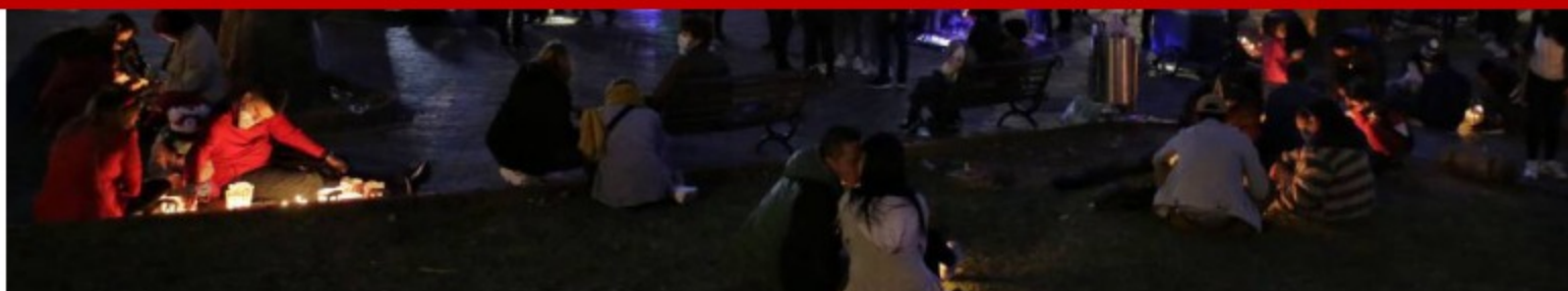
Se salva la noche de las velitas