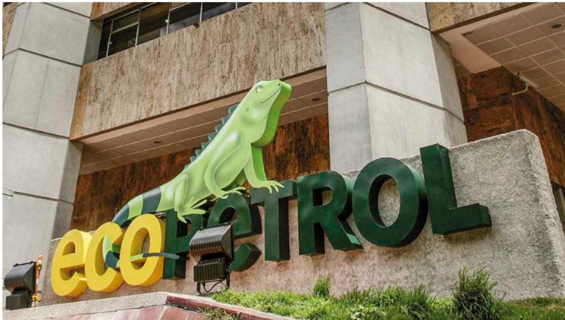
La petrolera colombiana registra las mejores utilidades en mucho tiempo.

SEMANA: ¿A cuánto ascendieron las inversiones de este año?