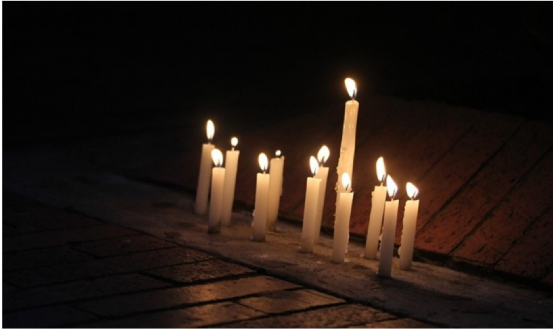
La noche de las velitas en Colombia podría no tener suficientes velitas este año.