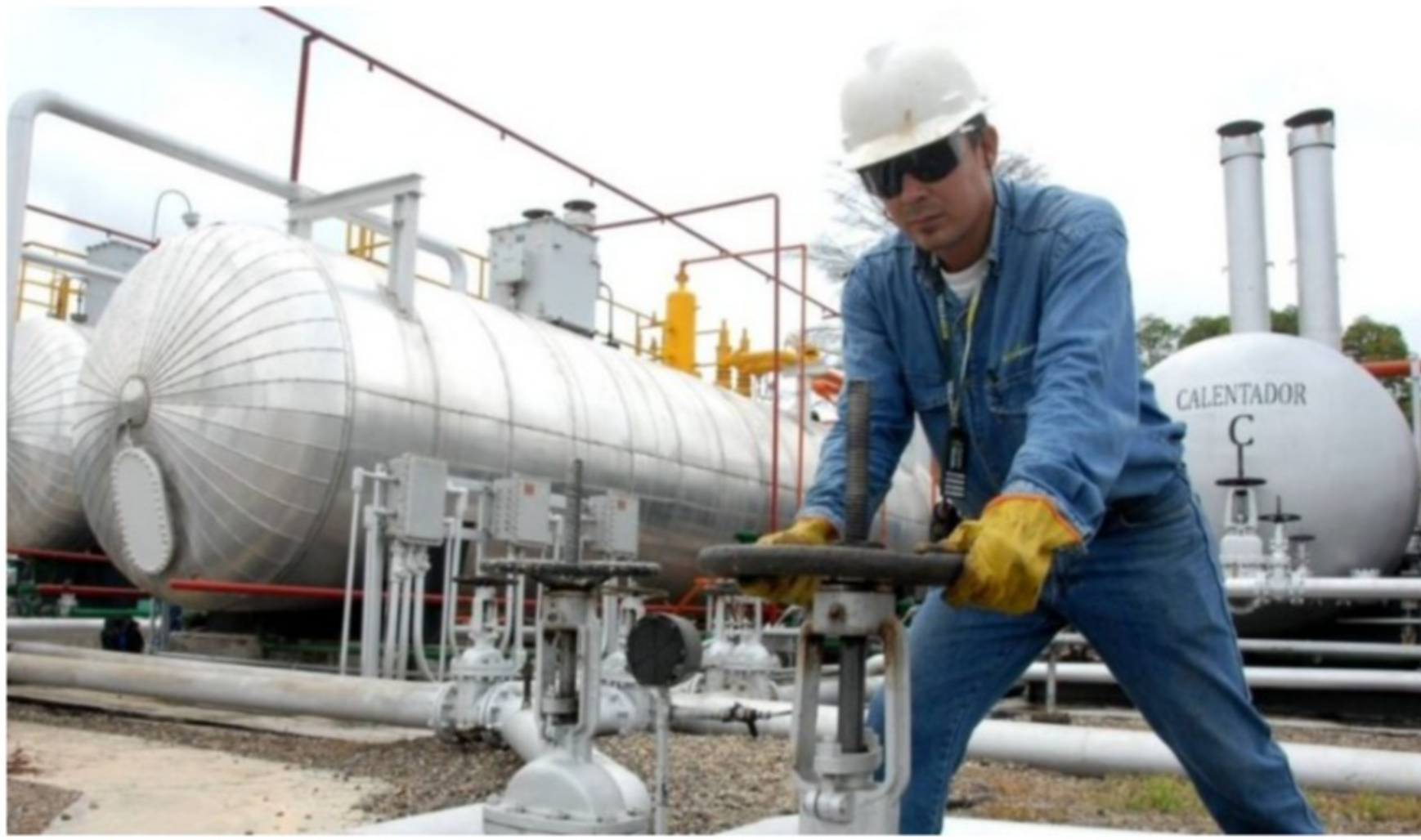
Ecopetrol aumenta sus reservas de gas y petróleo.

La estatal petrolera Ecopetrol anunció una buena noticia para el país, las nuevas reservas de Petróleo y Gas ubicada en Aguazul, Casanare.