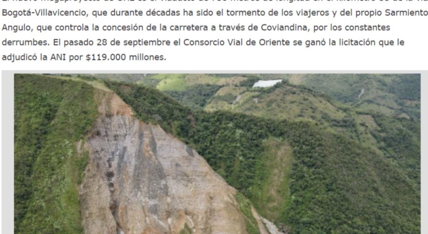
El último gran contrato que se ganó OHL fue para la construcción del viaducto del km 58 de la vía Bogotá-Villavicencio, un contrato de casi 120 mil millones que le adjudicó la Agencia Nacional de Infraestructura. ANI al Consorcio Vial de Oriente, del que es socio OHL. El km58 ha sido un dolor de cabeza en las últimas décadas y por los constantes derrumbes el comercio entre los llanos orientales y el centro del país se ha visto duramente golpeado.

El nuevo megaproyecto de OHL es el viaducto de 750 metros de longitud en el kilómetro 58 de la vía Bogotá-Villavicencio, que durante los últimos años ha sido el tormento de los viajeros y del propio Sarmiento Angulo, que controla la concesión de la carretera a través de Covandina, por los constantes derrumbes. El pasado 28 de septiembre el Consorcio Vial de Oriente se ganó la licitación que le adjudicó la ANI por $119.000 millones.