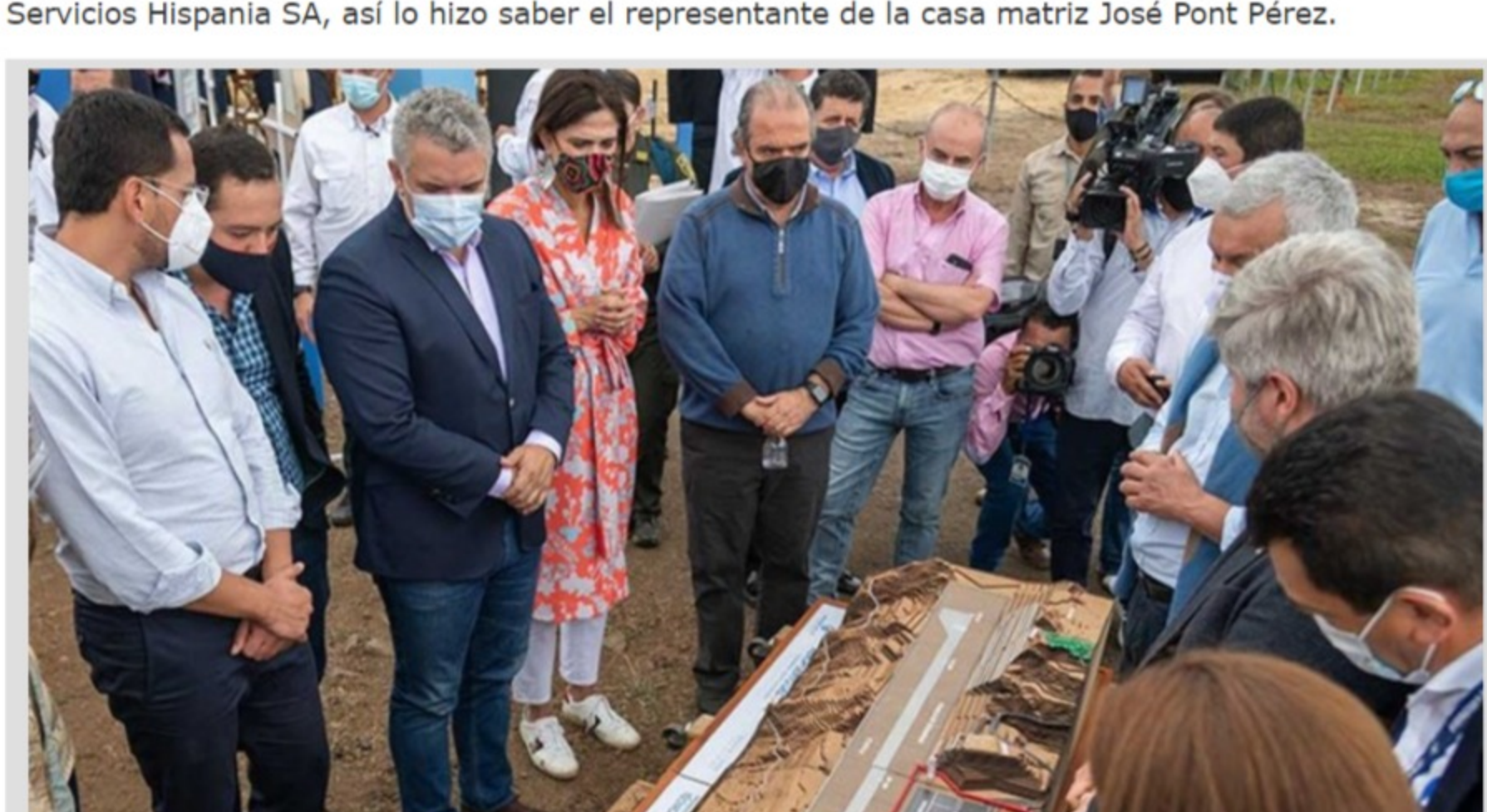
El gobernador de Caldas, junto al presidente Duque y la Mintransporte Ángela María Orozco revisando los planos del Aeropuerto del Café, que deberá ser entregado en 2022.