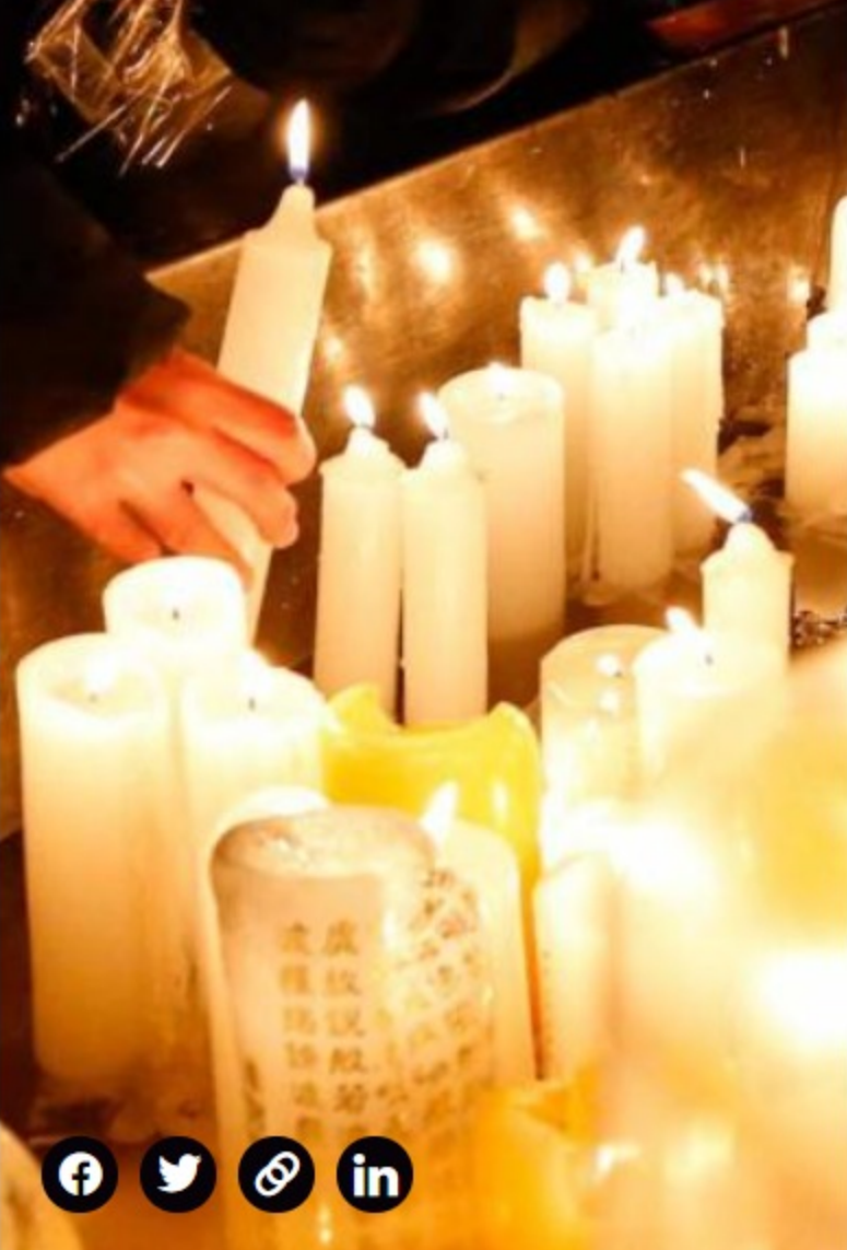
Las velas necesitan de la parafina para su elaboración.

Este fenómeno no solo se produce en Colombia, pero se resentirá más en las épocas decembrinas por la costumbre anteriormente reseñada.