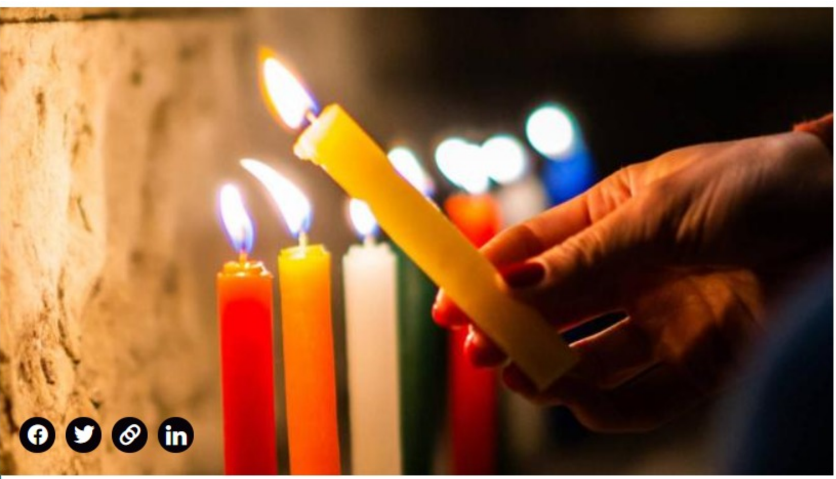
Este año hay una probabilidad alta de que escaseen las velitas.

(Puede leer: Confianza del consumidor está en el nivel más alto desde enero de 2020).