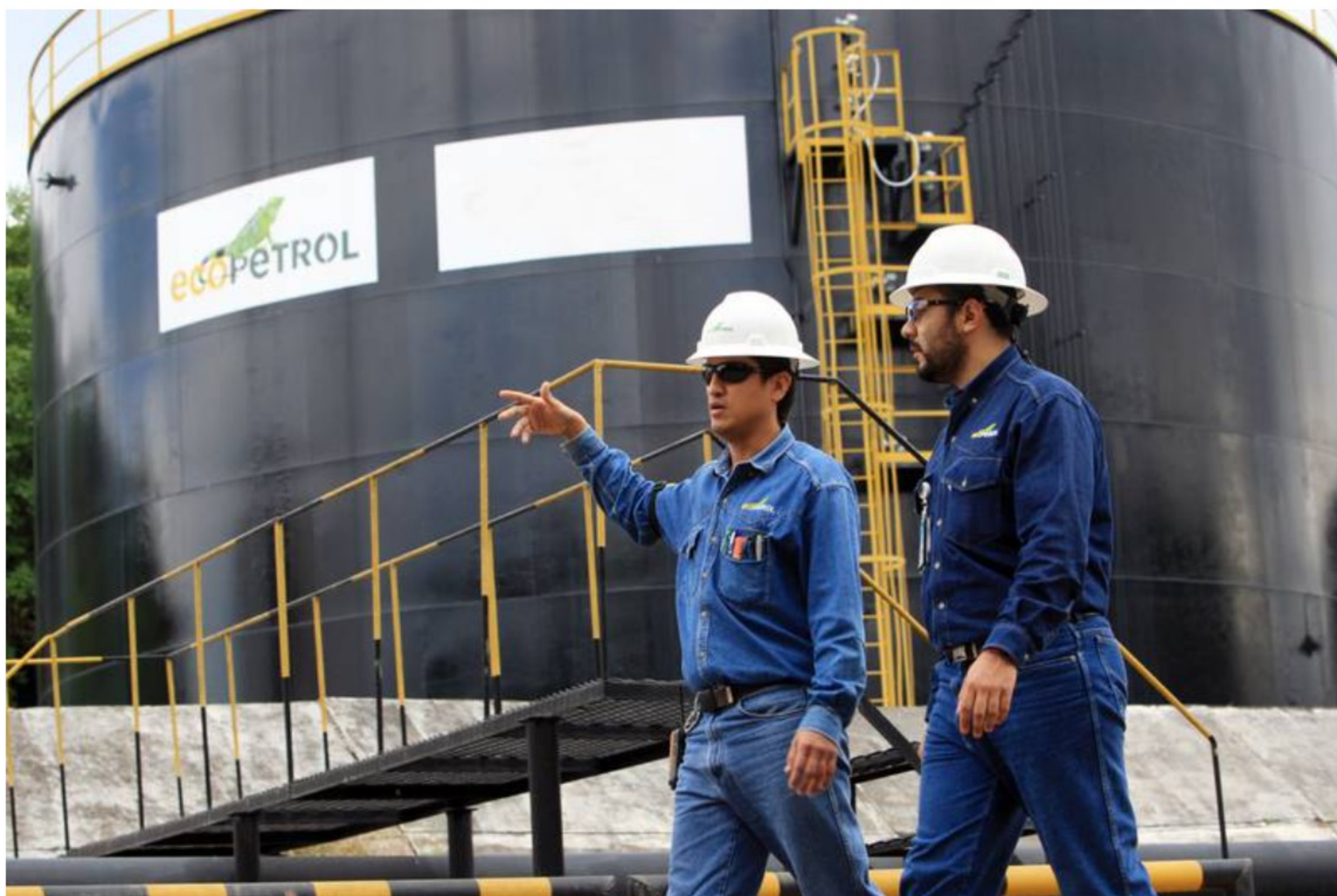
Ecopetrol Nuevo hito: Ecopetrol anuncia hallazgos de petróleo y gas en Colombia.

El descubrimiento llega en un momento en el que los precios del crudo enfrentan una buena racha. Ayudará a mantener seguridad energética del país.