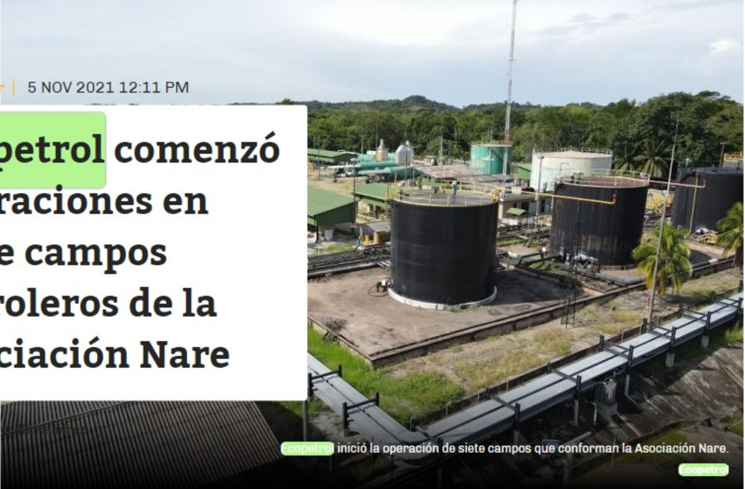
Ecopetrol inició la operación de siete campos que conforman la Asociación Nare.

Los campos estarán a cargo de la vicepresidencia de operaciones regional central de Ecopetrol .