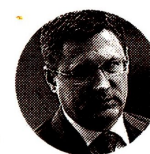
Alexander Novak Viceprimer Ministro de Rusia

El rechazo provocó una rápida respuesta de la Casa Blanca, que reiteró que considerará “toda la gama de herramientas” para proteger la economía. Los precios del crudo borraron las ganancias an-