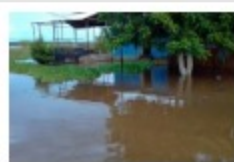
No para afectación en la región por invierno en el Magdalena Medio