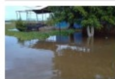
Video: Creciente en la Ciénaga Yarirí inundó 150 familias en Puerto Wilches