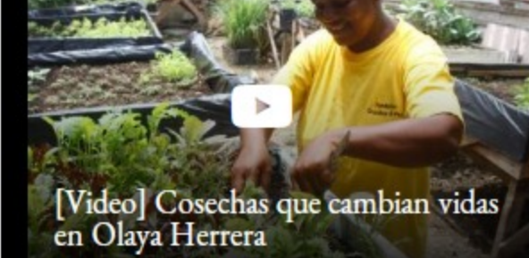
[Video] Cosechas que cambian vidas en Olaya Herrera