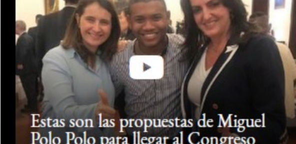
Estas son las propuestas de Miguel Polo Polo para llegar al Congreso