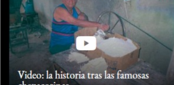
Video: la historia tras las famosas chepacorinas

Por sabrosa, saludable y sostenible, pon más carne en tu plato