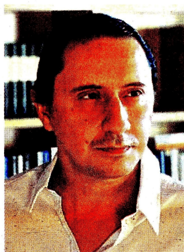
Thierry Ways, empresario y columnista de opinión.