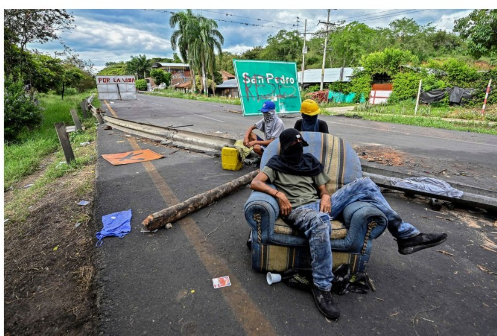
Manifestantes bloquean la carretera Panamericana entre Buga y Cali, durante una protesta contra el gobierno en el departamento del Valle del Cauca, Colombia, el 26 de mayo.