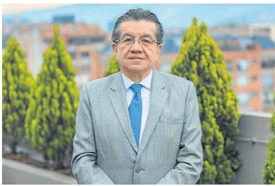
Ministerio de Salud

La emergencia sanitaria va hasta el 31 de agosto