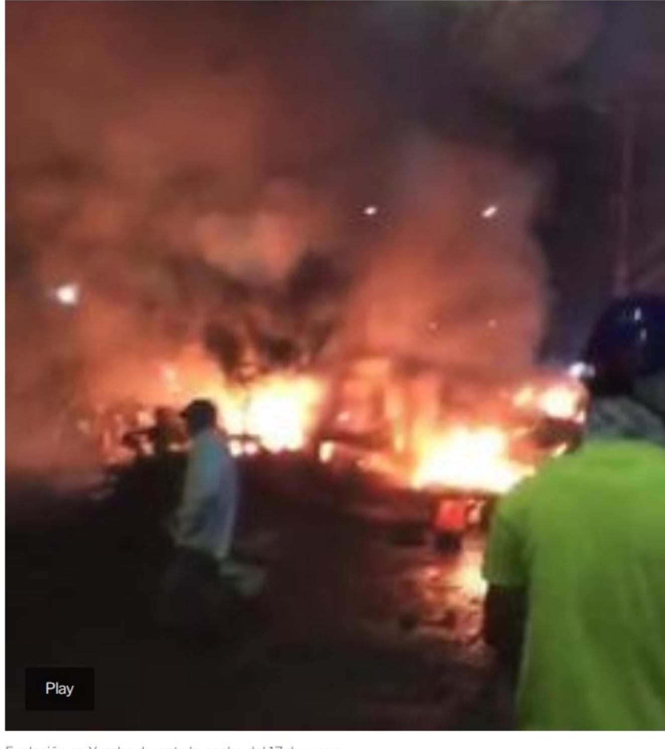
Explosión en Yumbo durante la noche del 17 de mayo

En el siguiente video se ve el momento de la explosión y algunos manifestantes cubriéndose. Como fondo la arenga: "Resistencia, resistencia".