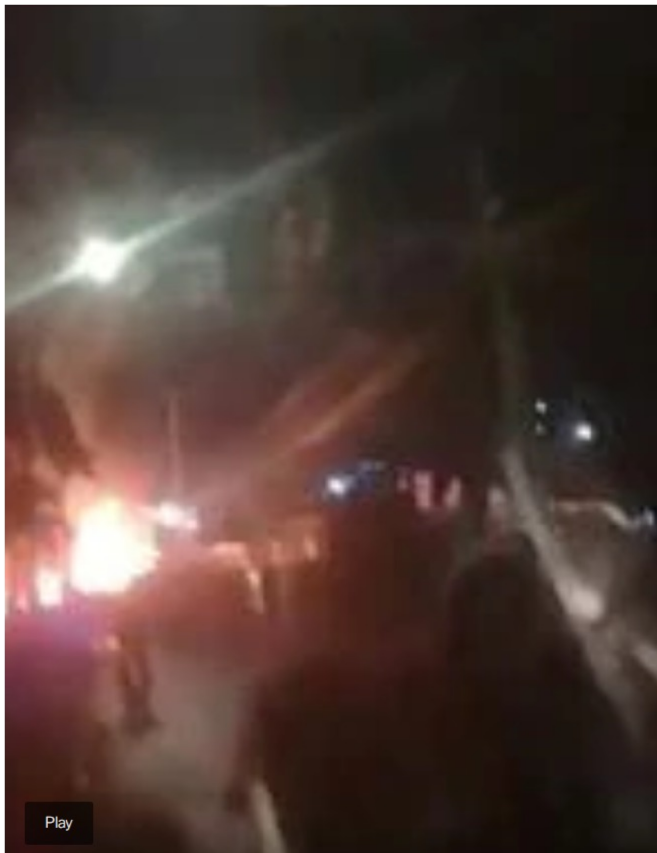
ONIC denuncia que Esmad disparó contra la minga en Yumbo la noche del 17 de mayo.

El trino compartido por la Onic está acompañado del siguiente video, en el cual se escuchan balazos y algunas personas diciendo: “Esos son disparos. Abajo, abajo. Nos están disparando” . También se escucha a alguien comentando, “con el escudo, con el escudo”.