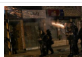
Congresistas de EE.UU. piden retirar ayudas a policía colombiana

De acuerdo con expertos, "lo que se ve en las protestas es un gran despertar de los jóvenes y es el reflejo de un país que no se siente reconocido ni en la institucionalidad ni en los partidos políticos".