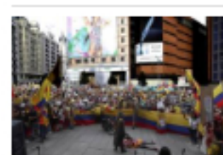
Colombianos vuelven a protestar en España contra la "masacre" en su país

El conflicto ha seguido escalando en el país hasta llegar a la confrontación con la Fuerza Pública, tal como se registró en ciudades como Cali y Bogotá.