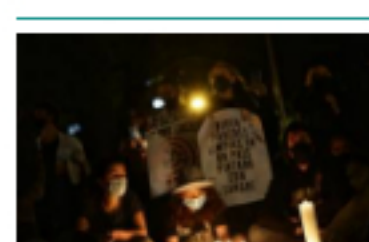
¿Dónde están los desaparecidos durante las protestas del Paro Nacional en Colombia?