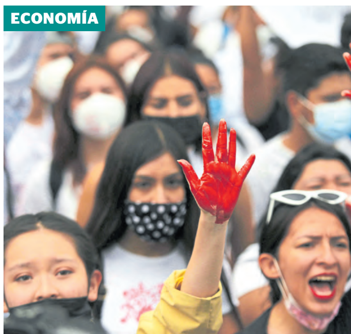
Según el Dane, la situación más compleja la enfrentan las mujeres.

Ambas actividades crecieron frente a igual mes del 2020. También aumentaron comparadas con el mismo periodo de 2019. En el primer trimestre del 2021, la industria tuvo un incremento de 6,2% y el comercio 4,7%, contra el mismo lapso de hace un año. Pág. 3