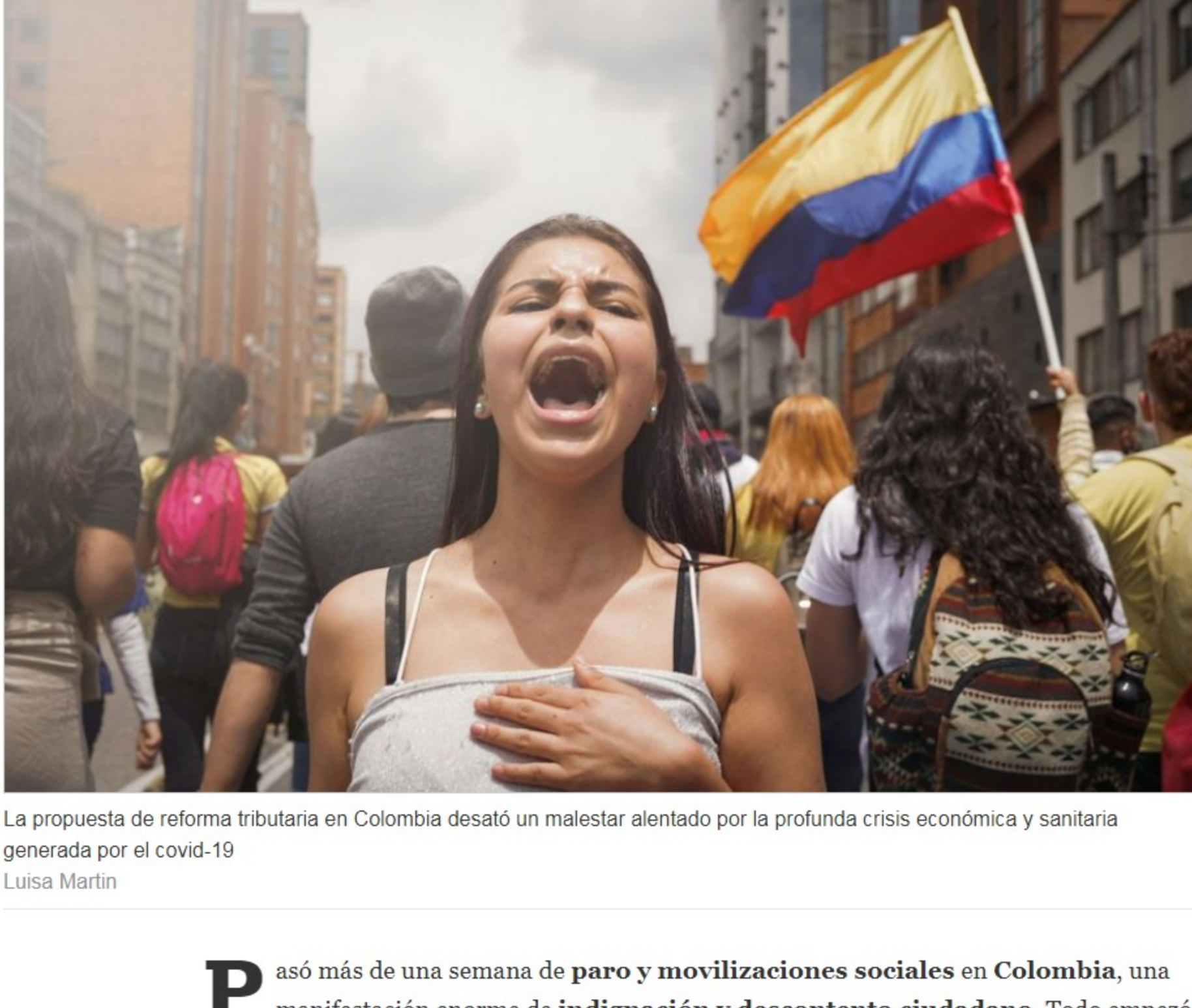
La propuesta de reforma tributaria en Colombia desató un malestar alentado por la profunda crisis económica y sanitaria generada por el covid-19 Luisa Martín

P asó más de una semana de paro y movilizaciones sociales en Colombia, una manifestación enorme de indignación y descontento ciudadano . Todo empezó con la propuesta de reforma tributaria del presidente Duque y su Ministro de Hacienda Alberto Carrasquilla . Fue el Florero de Llorente. Fue eso lo que les facilitó a las centrales obreras y a las organizaciones sociales dar un golpe de gracia y sacar a la calle a millones de personas . Después cada quien le fue agregando sus propios motivos: los jóvenes su dolor contra los atropellos policiales y su desesperanza; los pobres y los marginados, el deseempleo y el hambre ; las clases medias la grave crisis económica que trajo la pandemia con el desempleo y el cierre de pequeñas empresas; los campesinos la amenaza de las fumigaciones y el olvido ; los defensores de la reconciliación, las graves violaciones al acuerdo de paz con su estela de muerte a las excombatientes y a los líderes sociales; el país entero las graves deficiencias del sistema de salud sacudido por el Covid-19, la lentitud de la vacunación. Es un doloroso ramillete de motivos.