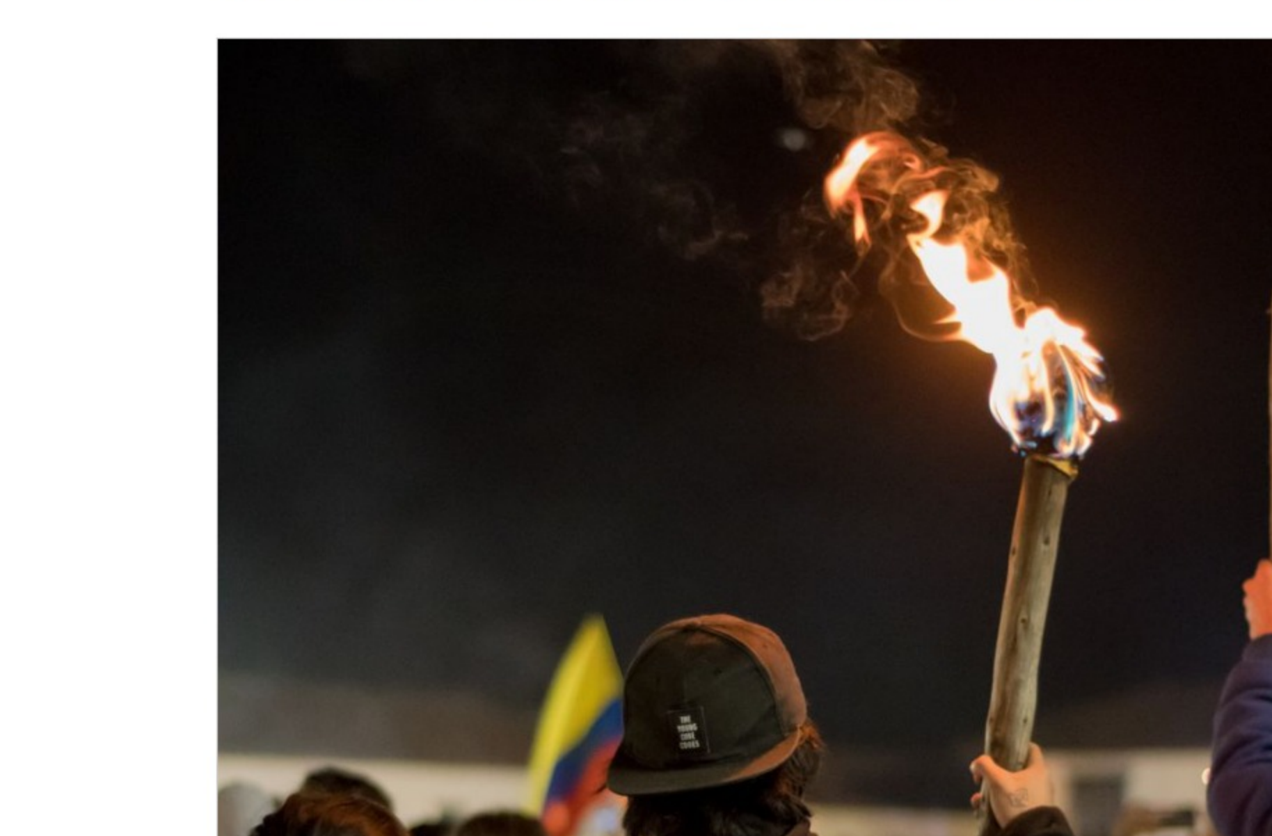
El único camino para resolver el profundo conflicto desatado en Colombia parece ser un gran acuerdo nacional entre todos los partidos independientes y de oposición Juan Sebastián López

Con una propuesta de Pacto Social y Político el gobierno de Duque podría lograr un acuerdo nacional entre todos los partidos independientes y de oposición y recuperar el apoyo de la comunidad internacional tan maltrecho en este momento.