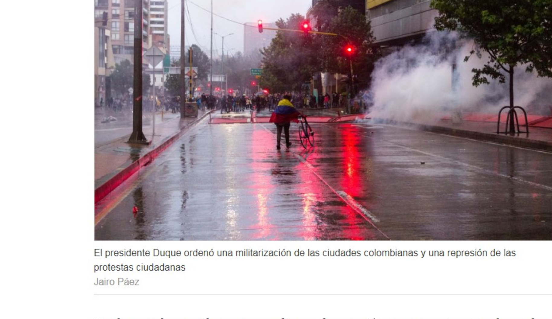
El presidente Duque ordenó una militarización de las ciudades colombianas y una represión de las protestas ciudadanas Jairo Páez

A renglón seguido, el presidente Duque ordenó una militarización de las ciudades y una represión de las protestas ciudadanas acudiendo al ESMAD, el cuerpo policial más agresivo y violento, con el resultado hasta ahora de 36 civiles y un capitán de la policía asesinados y cientos de heridos entre ciudadanos y miembros de la fuerza pública . En la confrontación se produjeron además destrucción de bienes y saqueos en todas las ciudades. La Organización no Gubernamental Temblores registra 1708 hechos de violencia policial .