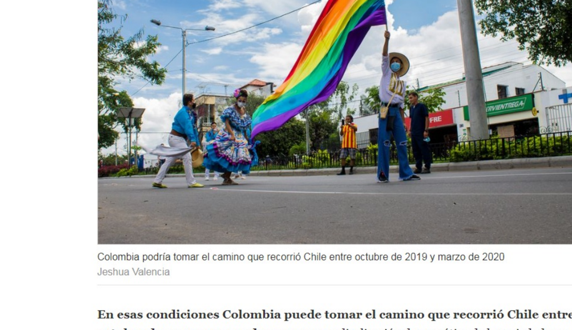
Colombia podría tomar el camino que recorrió Chile entre octubre de 2019 y marzo de 2020 Jeshua Valencia

Es muy probable que Duque fracase en su pretensión de controlar el país y ahogar la oleada de protestas por la fuerza o con el engaño de una conversación sin resultados inmediatos.