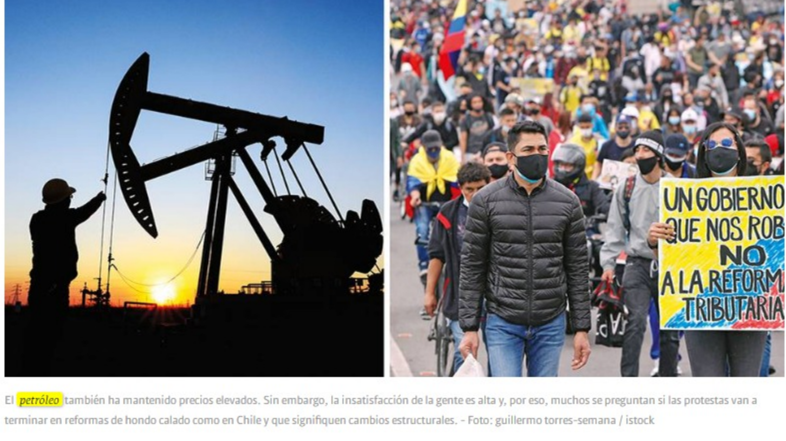
El petróleo también ha mantenido precios elevados. Sin embargo, la insatisfacción de la gente es alta y, por eso, muchos se preguntan si las protestas van a terminar en reformas de fondo calado como en Chile y que signifiquen cambios estructurales.

"Pero en el último mes pasó algo particular. La presión se moderó porque Estados Unidos dejó de liderar la recuperación. A nivel mundial, ha caído el dólar. Es cuando Colombia empieza con estos casos locales de orden público por las manifestaciones y se separa del resto de países", comentó Campos.