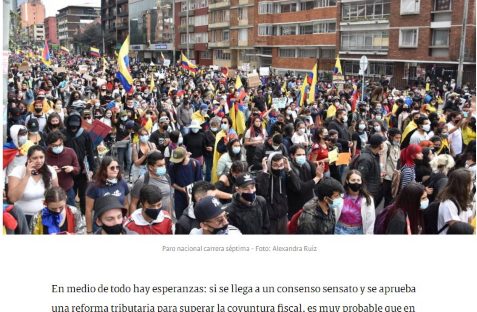
Paro nacional carrera séptima

Que llegáramos a repetir lo de Chile en Colombia sería el caso más extremo. Allí todo comenzó con una discusión sobre impuestos de transporte y de repente, en el transcurso de los eventos, la economía terminó sufriendo un efecto. "En Colombia ya esto va más allá de la reforma tributaria y el grado de inversión. ¿Cuánto tendrá que negociar el Gobierno para superar la crisis?", se preguntó Campos.