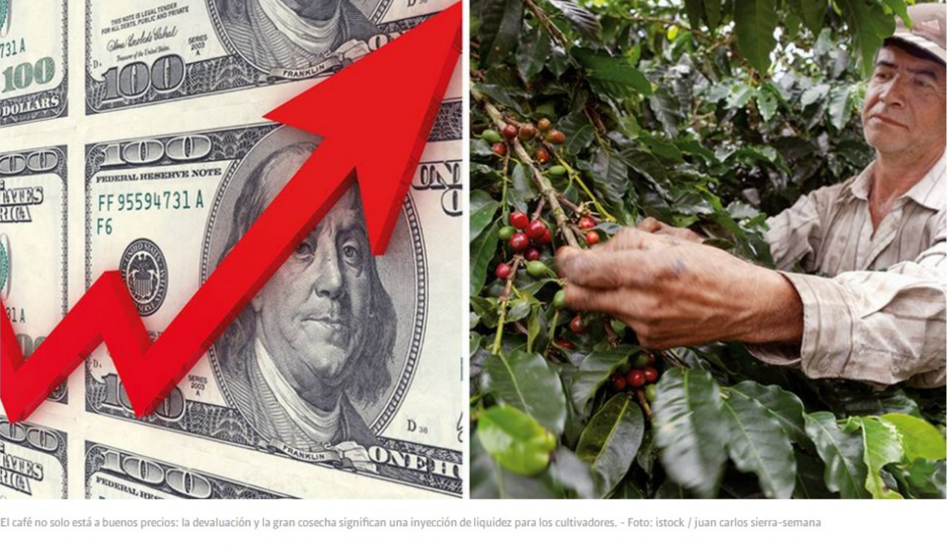
El café no solo está a buenos precios: la devaluación y la gran cosecha significan una inyección de liquidez para los cultivadores.

Que el dólar suba no es una novedad en Colombia. En momentos de grandes crisis fiscales o de choques externos, la divisa se dirige siempre hacia sus máximos históricos. El más reciente caso, antes de la pandemia, se dio durante la caída de los precios del petróleo a partir de 2014, que puso al país frente al mayor choque externo de su historia. Ya durante la pandemia, el dólar se disparó hasta 4.300 pesos por la incertidumbre en el mercado del crudo, que llegó incluso a cotizarse a precios negativos.