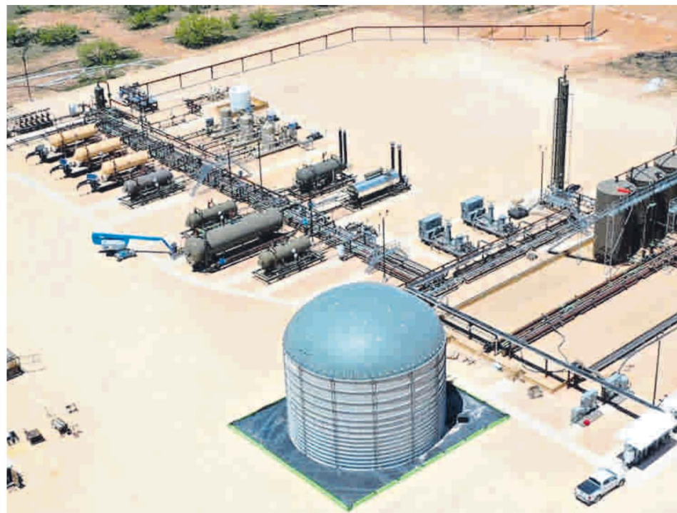
Kalé de Ecopetrol y Platero de ExxonMobil, pilotos de ‘fracking’ aprobados por la ANH. Ecopetrol