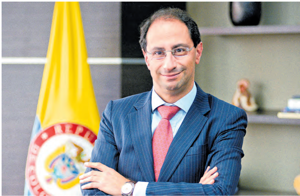
José Manuel Restrepo, nuevo ministro de Hacienda y crédito público.

El Ministro de Hacienda asegura que reducirán el gasto público y que el nuevo texto de la reforma pretende recaudar unos $14 billones. "Buscamos que el proyecto sea muy prudente... Nosotros no hemos dicho que no a todas las propuestas, ahí es donde surge el consenso". Págs. 6 y 7