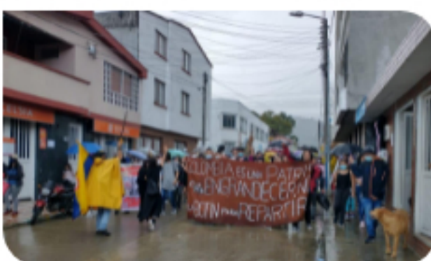
Miércoles, abril 28, 2021 De manera masiva Líbano marchó