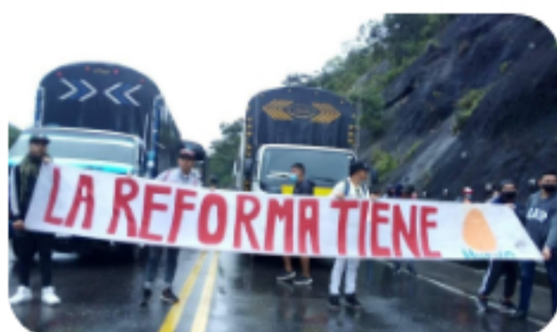
Viernes, abril 30, 2021 El paro se mantiene de camioneros bloquean el puente de Cajamarca