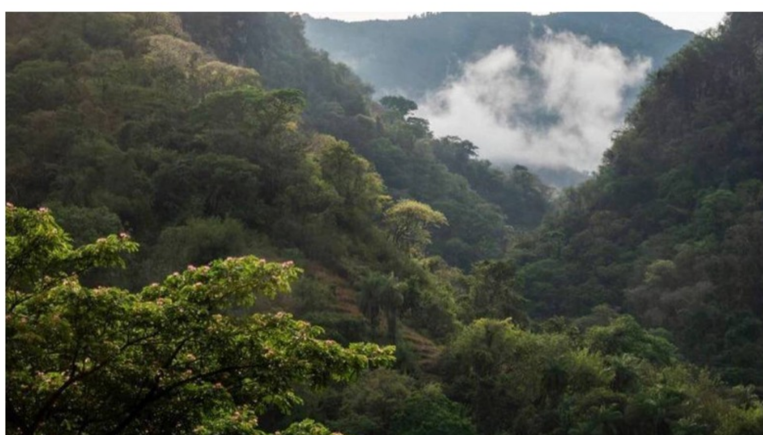
En el departamento de Antioquia también se trabaja en áreas de compensación ambiental a través de bancos de hábitat.

De esta forma, durante dos años estos socios trabajarán para alcanzar la meta de transformar 5.000 hectáreas de ecosistemas amenazados como el bosque seco tropical, el bosque húmedo tropical, el bosque de niebla y las sabanas, en zonas que potencien la biodiversidad del país.