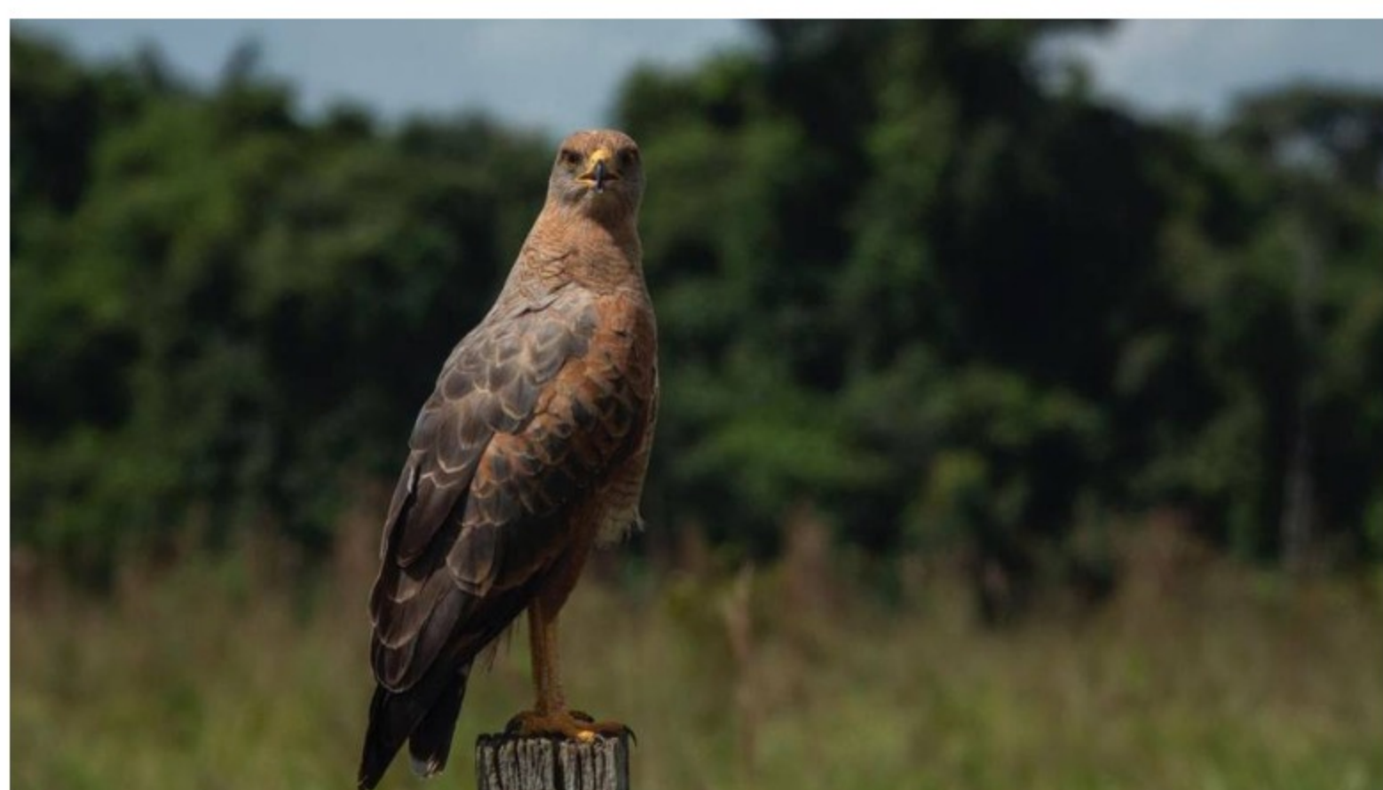
En el departamento del Meta ya se encuentra un Banco de hábitat, el primero no solo del país, sino de Latinoamérica.

Se trata de los Bancos de Hábitat, que son áreas donde es posible realizar actividades de preservación, recuperación o uso sostenible para la conservación de la biodiversidad, en compensación por los efectos que genera el desarrollo a actividades como la infraestructura y otras extractivas como la minería .