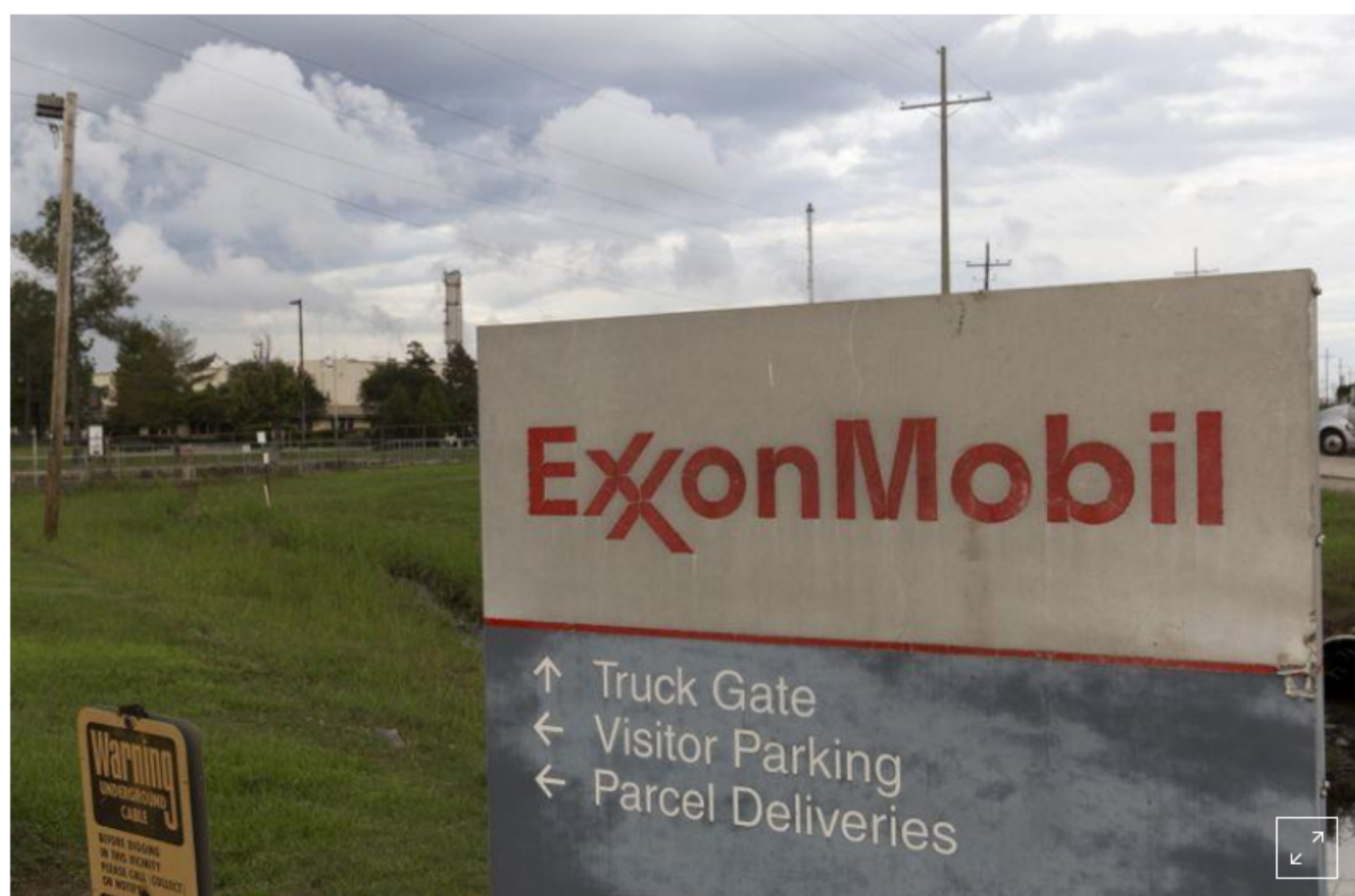
FOTO DE ARCHIVO: Se ve un letrero en la entrada de la Planta de Lubricantes Exxonmobil Port Allen en Port Allen, Louisiana, 6 de noviembre de 2015.

BOGOTÁ (Reuters) - Colombia aprobó provisionalmente el plan de la petrolera estadounidense ExxonMobil Corp para desarrollar un proyecto piloto de fracturación hidráulica, conocido como fracking , en la cuenca del Valle Medio del Magdalena del país, dijo el miércoles el regulador petrolero.