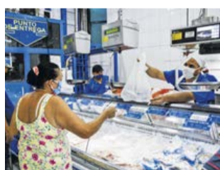
Compradores de pescado.

ejecutivo de Fedeaqua, explicó que “tener preferencia por la procedencia nacional de los productos pesqueros es de suma importancia para jalonar todo el sector. Cuando se escoge un filete o pescado colombiano, se está apoyando a cientos de empresas y familias que están detrás de ese producto, que día a día trabajan para garantizar la reactivación económica con la oferta de un alimento de calidad”.