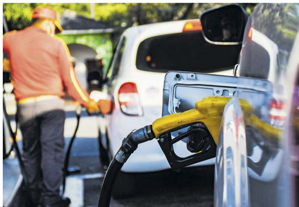
Una de las estaciones de gasolina que operan en la capital del Atlántico.

“Esto sería preocupante porque ya tienen unos gravámenes muy altos,