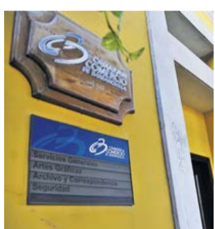
Sede de la Cámara de Comercio de Barranquilla.

La renovación se puede realizar en la sede virtual: www.camarabaq.org.co/renueva-2021 con atención las 24 horas para pagos en línea con tarjeta débito o crédito. Para pago en efectivo está la herramienta “servicio a domicilio con Mandaos”.