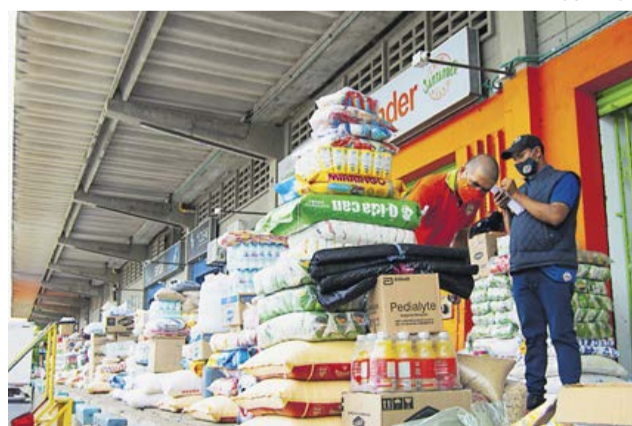
Locales ubicados en Granabastos.

El ingreso de pescado a la central se incrementó en un 10% para atender el crecimiento de la demanda de este producto en la Semana Mayor, sin embargo los precios se mantienen estables.