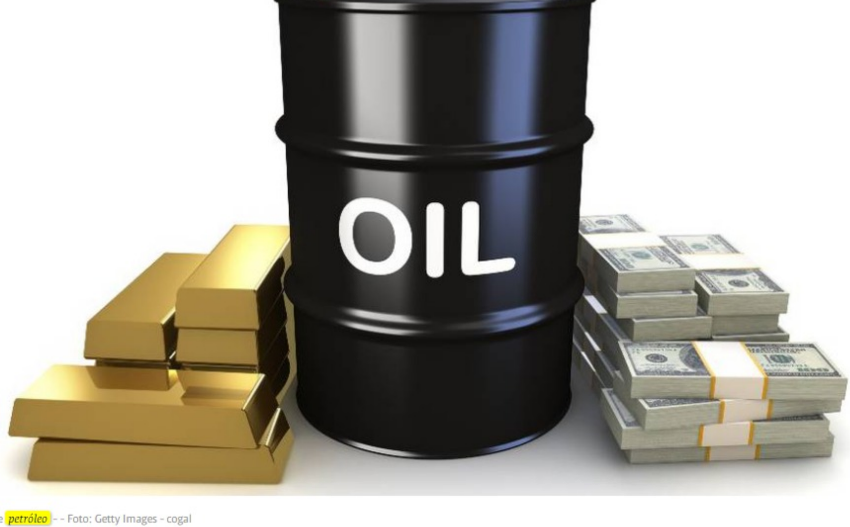
Barril de petróleo

Continúa la volatilidad de los precios del petróleo en este arranque del 2021, pues a principios de marzo alcanzaron a llegar a máximos de hace más de un año, pero en los últimos días han venido cayendo nuevamente.